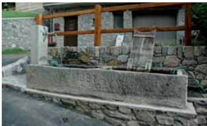
Il fontanile del 1887 ripristinato