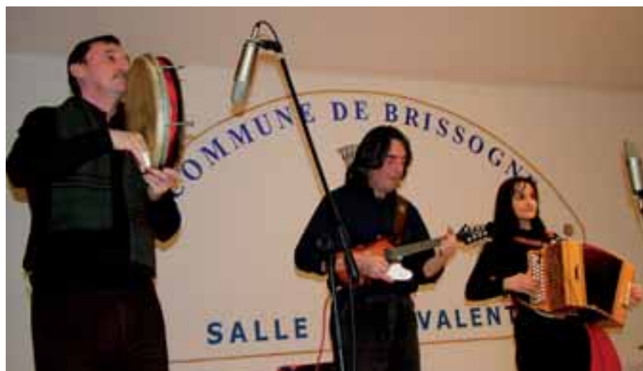
11 febbraio 2012, i Ficellartset in concerto