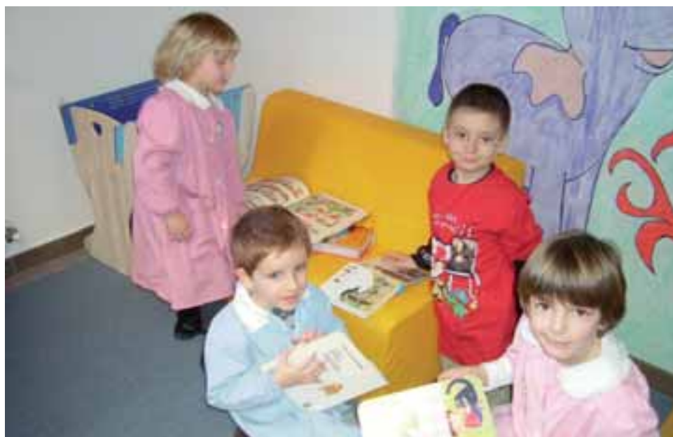
Bimbi della scuola materna scelgono un libro