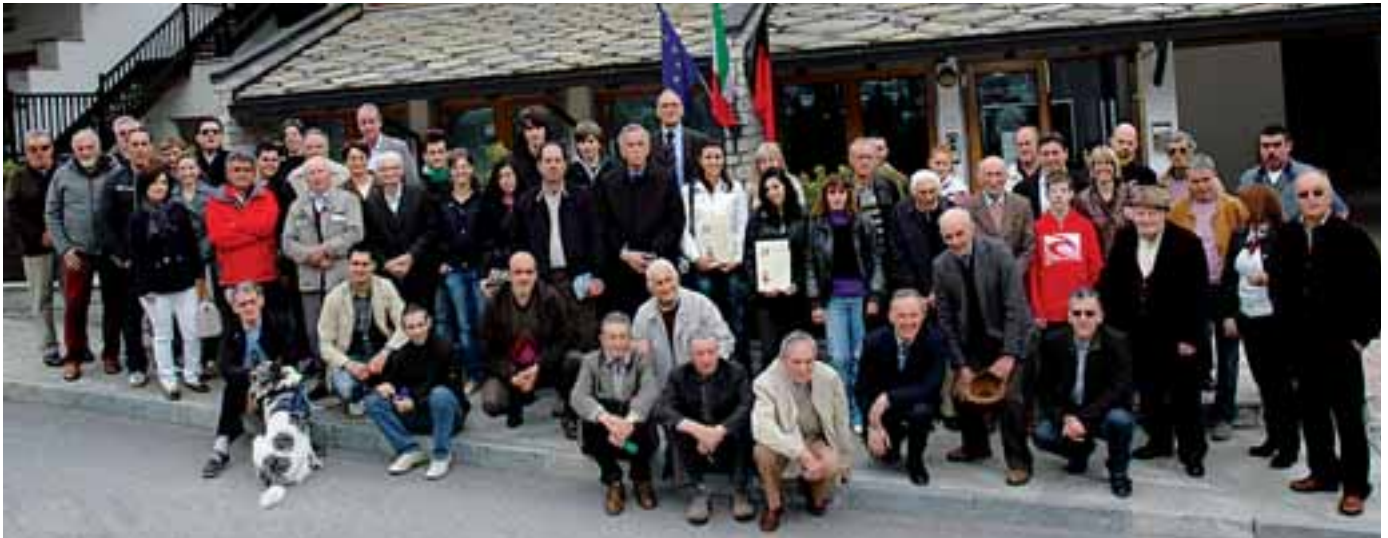
25 aprile, festa della Liberazione

hanno eseguito diversi lavori di restauro, muratura e verniciatura all'interno e all'esterno della sede, di proprietà comunale, provvedendo anche alla radicale pulizia delle pertinenze poste sul lato Ovest dell'attiguo municipio.