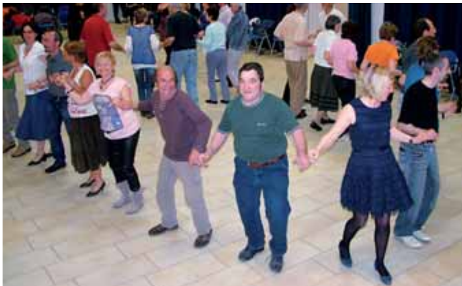
31 marzo 2012, serata danzante