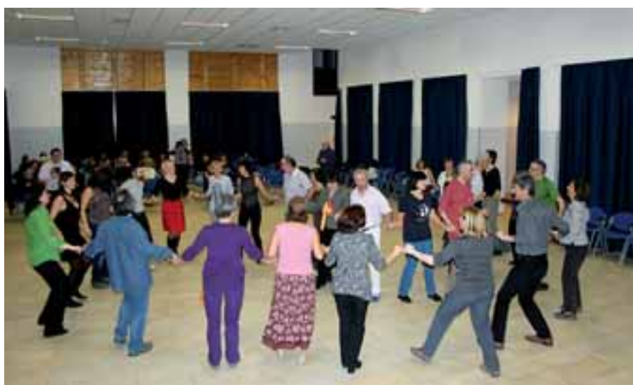
11 febbraio 2012, circolo circasso