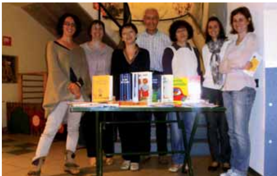
I relatori dell'incontro presso l'asilo nido di Saint-Christophe

Chi fosse interessato può trovare in biblioteca, su richiesta, le diapositive con tutte le indicazioni sui criteri di scelta del libro per la prima infanzia.