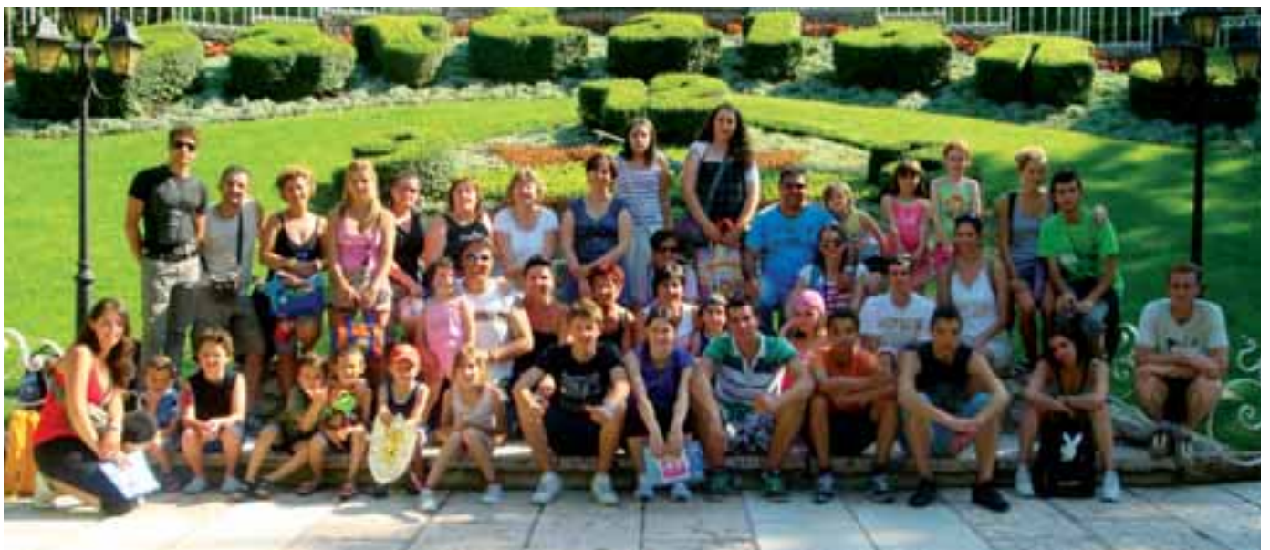
Gita della Pro Loco a Gardaland (16 giugno 2012)