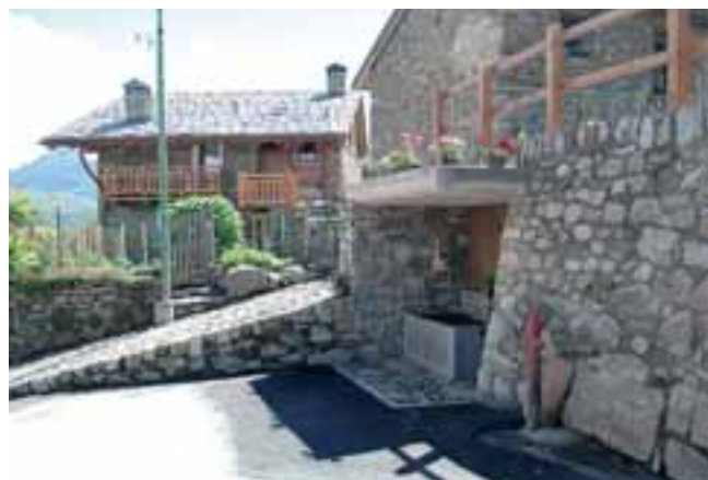
Sopra: rifacimento del fontanile situato nella parte bassa del villaggio Sotto: particolare