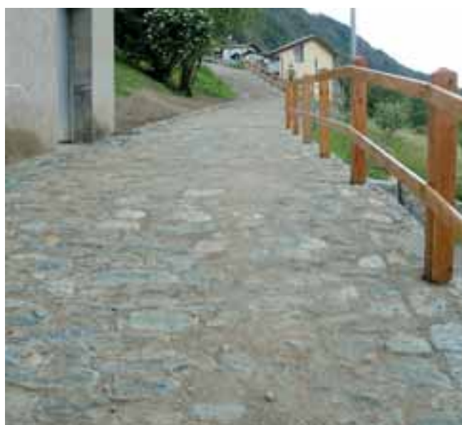
Il sentiero Chesalet - Grand-Brissogne