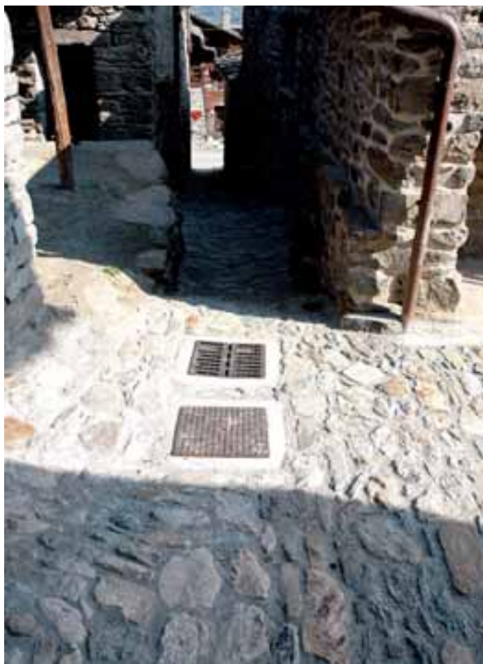
Un tratto della nuova pavimentazione