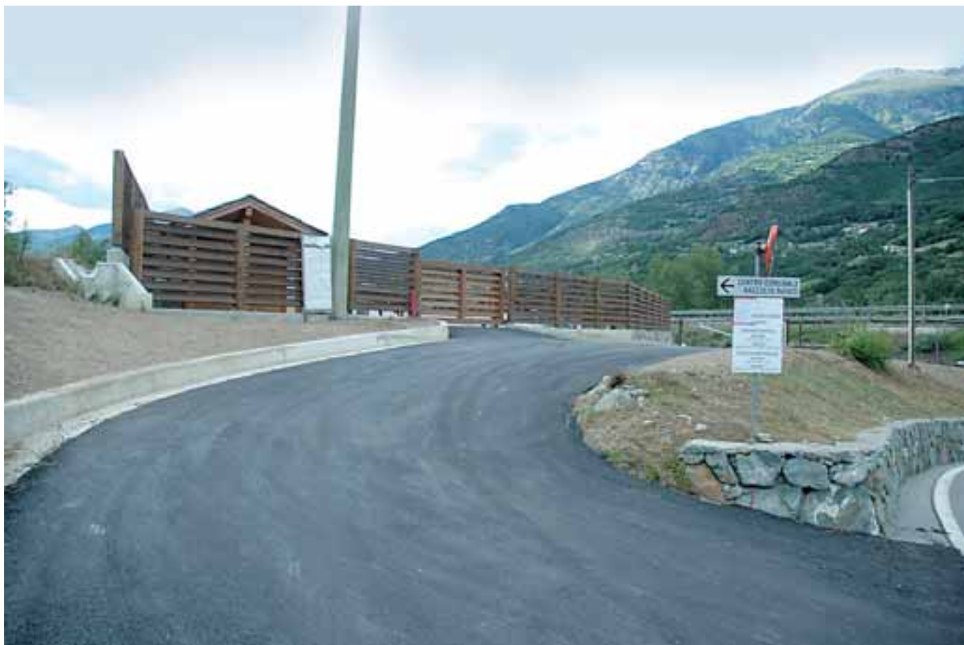
L'ingresso del nuovo Centro intercomunale raccolta rifiuti di Le Clapey

volgendo al termine. Quest'opera consentirà di conferire i rifiuti ingombranti e altre particolari tipologie di rifiuti, con evidenti benefici per l'ambiente.