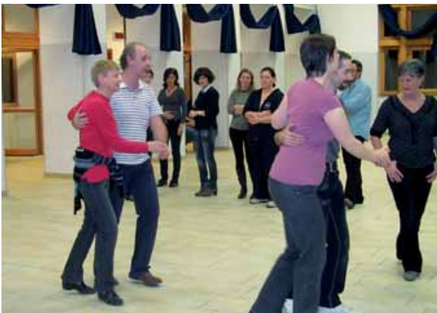
13 gennaio 2012, gli insegnanti all'opera