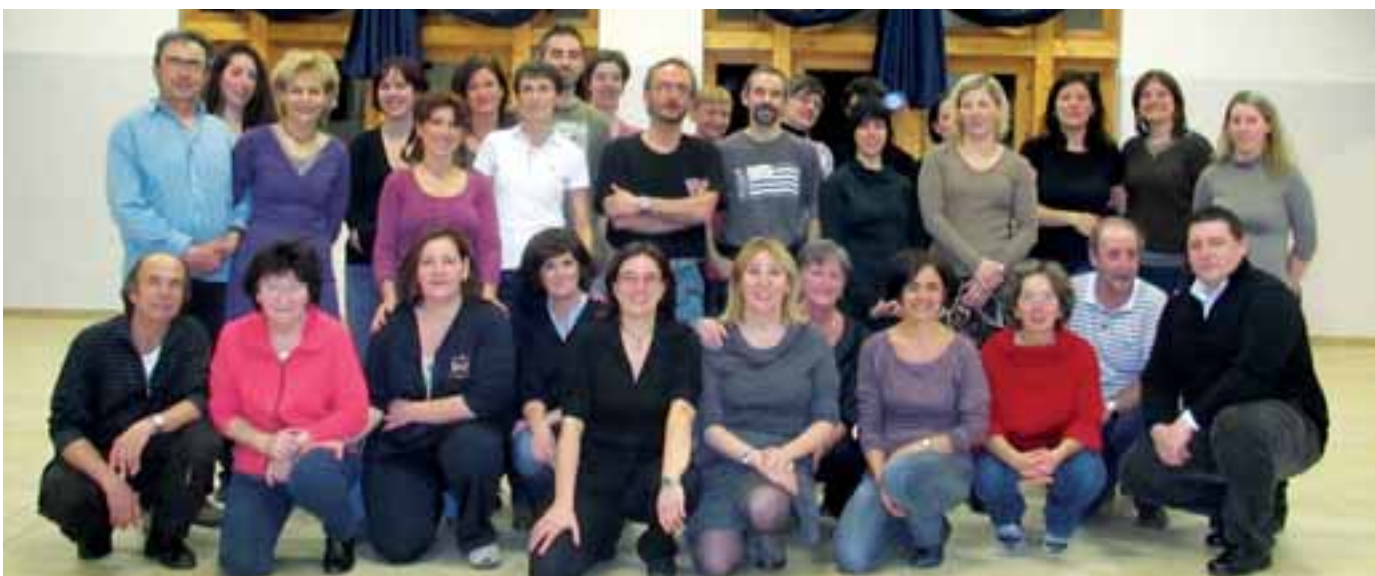
13 gennaio 2012, foto ricordo della prima lezione