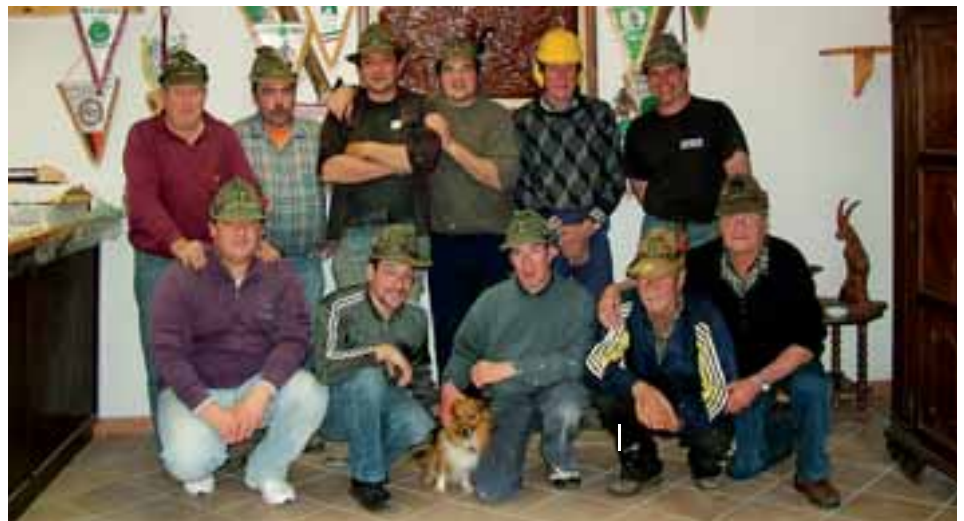
Gli alpini di Brissogne che hanno partecipato alla corvée del 28 aprile