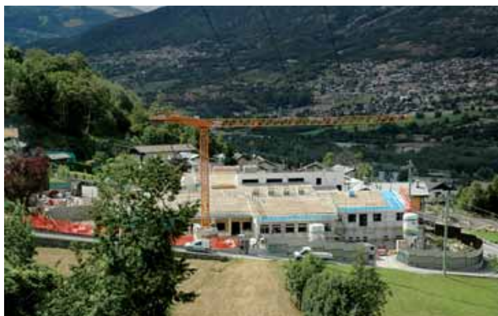
Veduta d'insieme del polo scolastico di Le Moulin

Sopra: la centralina idroelettrica in località Larp Sotto: il fabbricato di centrale con annesso sistemazioni esterne