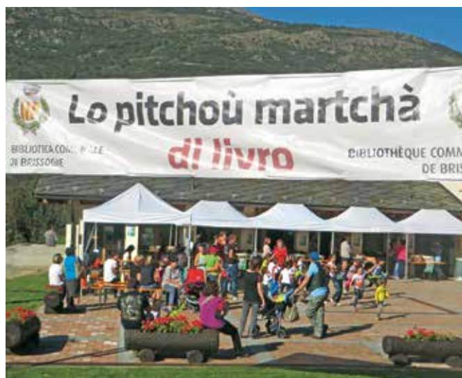
Piazzetta di Pâcou gremita.

Come ogni anno non è mancato l'appuntamento benefico promosso dalla commissione della biblioteca di Brissogne. Quest'anno, in accordo con la nuova amministrazione comunale, è stato organizzato il 20 settembre e, diciamo così, un perfetto giorno di fine estate: caldo, sole, senza nuvole e senza vento. Tecnicamente perfetto!