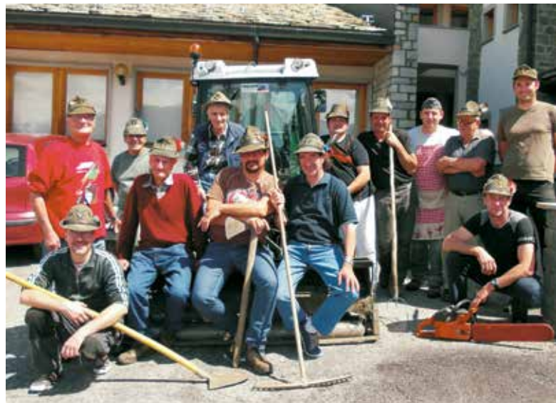
30 maggio – Corvée degli Alpini

Come avviene da diversi anni gli alpini del Gruppo Penne Nere di Brissogne hanno organizzato, in collaborazione con l'Amministrazione comunale, una giornata di lavoro sul territorio. Quest'anno il lavoro ha interessato la pulizia del sentiero che collega Chesalet a Pallu e al termine dell'intervento gli alpini si sono ritrovati presso la sede del gruppo dove è stato servito un ottimo rancio alpino! Un'iniziativa a favore di tutta la comunità che conferma i valori che gli alpini sanno sempre trasmettere nel loro agire: generosità e solidarietà. Grazie agli alpini!