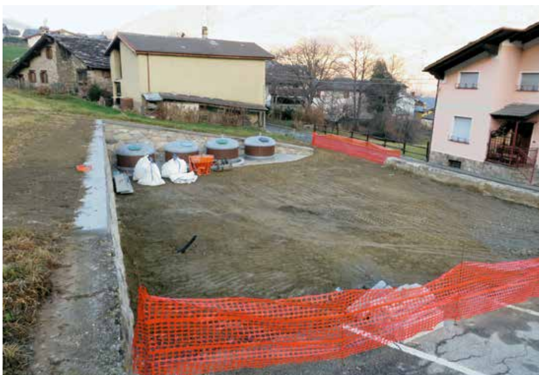
I lavori di ampliamento del piazzale di Boun-a Varda.

Nel corso dell'estate ed in autunno sono proseguiti i lavori di posa degli interrati nelle varie frazioni per migliorare la raccolta differenziata dei rifiuti. Queste nuove postazioni però non potranno ancora entrare in funzione finché non sarà completata la loro posa in tutti i comuni della Unité Mont-Émilis e non si sarà proceduto al nuovo appalto per la raccolta dei rifiuti a livello comprensoriale. Essendo in corso questi lavori, l'Amministrazione Comunale ha deciso di affidare alla ditta esecutrice Edilvi Costruzioni s.r.l. di Aosta l'ampliamento del parcheggio comunale in località Boun-a Varda per un importo complessivo di Euro 43.066,58 per 15 posti auto.