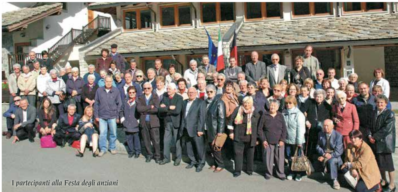
I partecipanti alla Festa degli anziani

pranzo presso il salone polivalente di Pâcou. È una giornata molto sentita di incontro e di ricordi, ma anche di gratitudine verso queste persone che tanto hanno fatto per la crescita della nostra comunità.