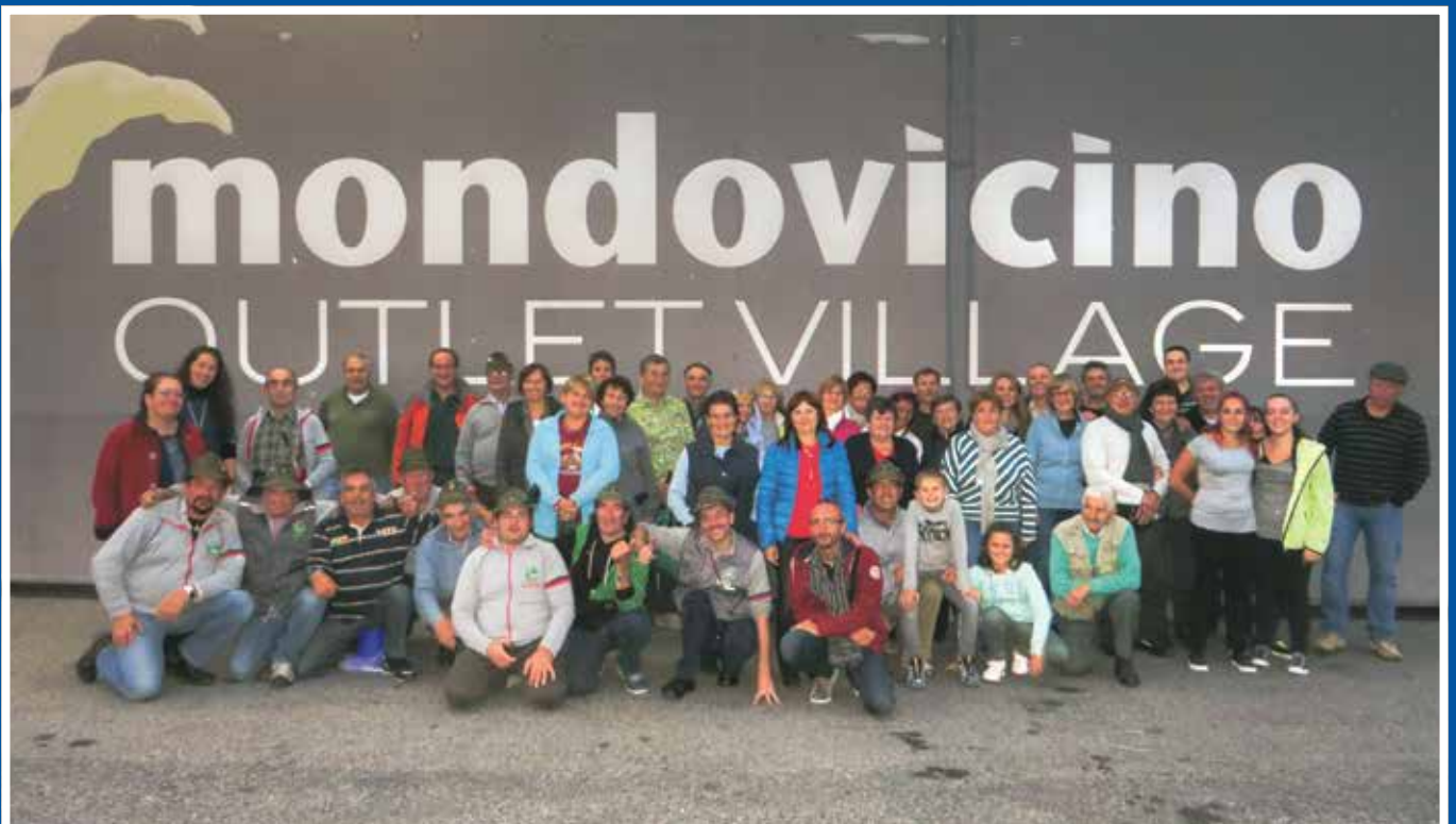
3/10/2015 Gita organizzata dal Gruppo Penne Nere, Pro Loco e Distaccamento dei Vigili del Fuoco Volontari.