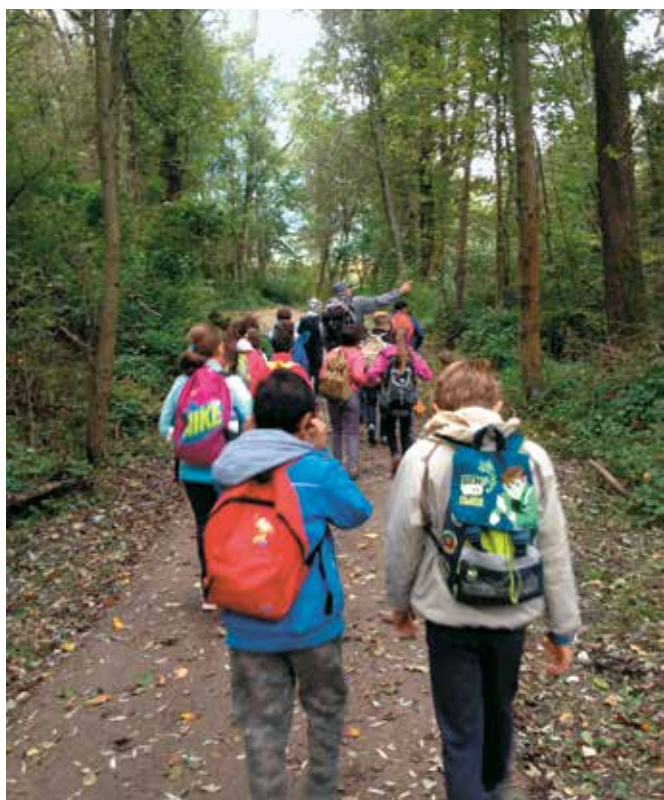
Escursione a Les Iles

Il 23 novembre, in occasione della settimana europea per la riduzione dei rifiuti, l'Amministrazione Comunale nelle persone del Sindaco, del Vice-Sindaco e dell'Assessore alla Pubblica Istruzione, è venuta a scuola per spiegarci come fare la raccolta differenziata dei rifiuti ed ha anche regalato a ogni famiglia un kit completo di tre borse colorate da utilizzare a casa. Tante altre attività ci aspettano per la seconda parte dell'anno: ateliers artistici al castello Baron Gamba di Châtillon, il corso di Sport tradizionali, la visita al Museo Egizio di Torino per i bambini di 4a e la gita finale allo zoo-safari di Pombia. Ma senza tralasciare lo studio naturalmente!