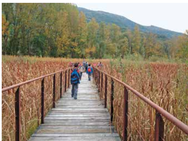
Ponte di legno nella zona umida