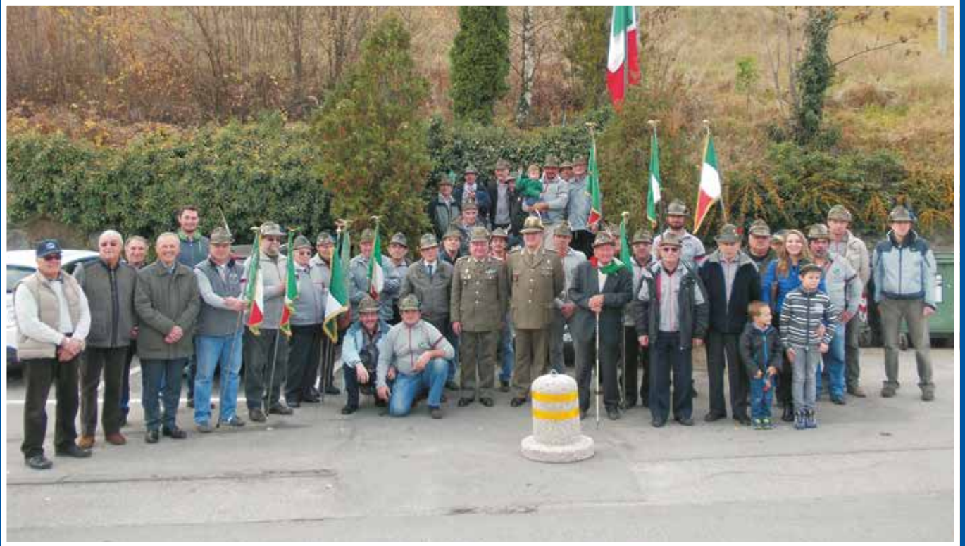
14/11/2015 Alpini in festa