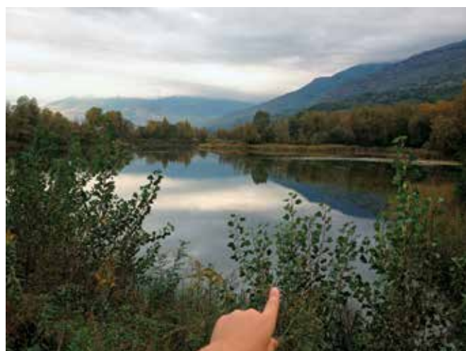
La zona umida