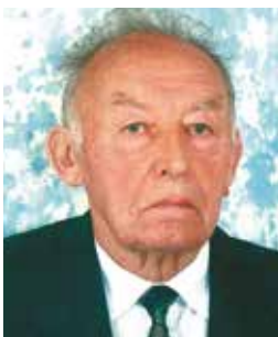
Ricordo Silvio M  nabr  az