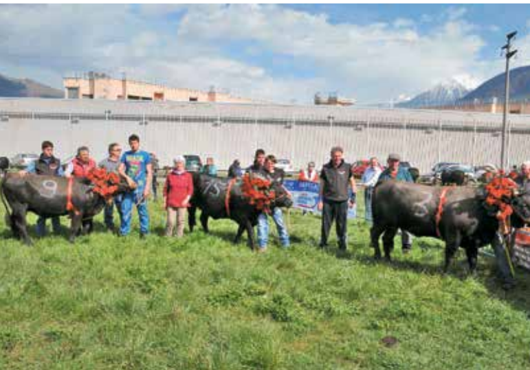
La Bataille de Moudzon di Brissogne

noci, cuocendolo nel forno di Chesallet. Il ricavato della vendita dei pani è stato devoluto alla scuola dell'infanzia di Brissogne.