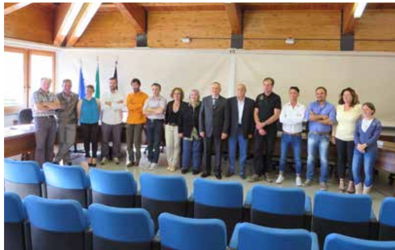
Il Consiglio Comunale