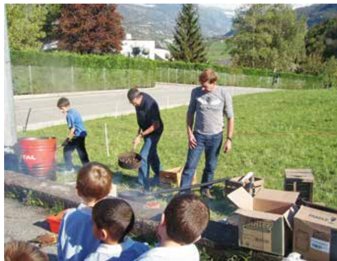
Castagnata a scuola

Abbiamo così potuto osservare da vicino la cottura delle castagne e, a merenda, ci siamo ritrovati con i nostri compagni