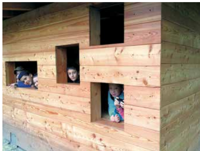
Appostamento nella zona umida