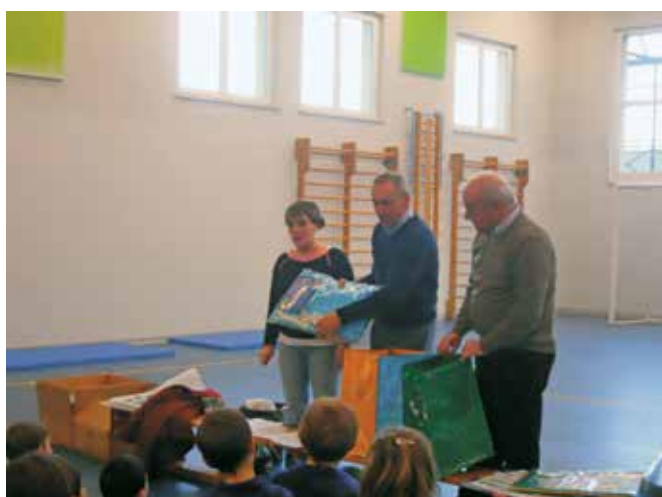
Spiegazione della raccolta differenziata