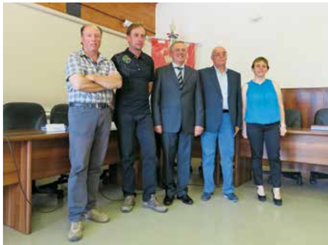
La Giunta Comunale