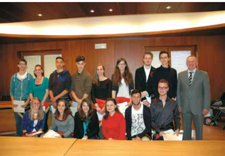
I diciottenni di Brissogne

tuare la pulizia del sentiero che sale alle Laures nel tratto compreso tra La Vieille e il Tramail. Muniti di decespugliatori, falcetti e rastrelli i volontari hanno eseguito un lavoro eccellente, molto utile e apprezzato da tutti coloro che percorrono questo bellissimo sentiero. Un grazie sincero all'Associazione "Amis des Laures" per questa bella iniziativa!