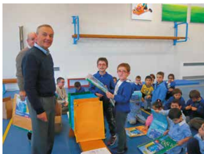
La Giunta consegna i kit