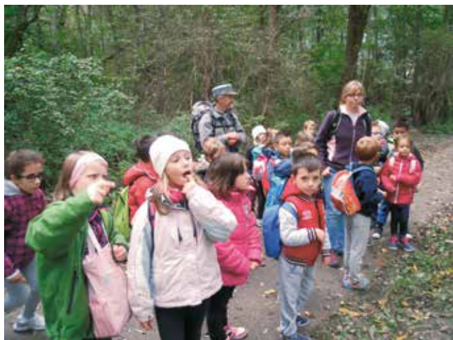
Bambini in gita