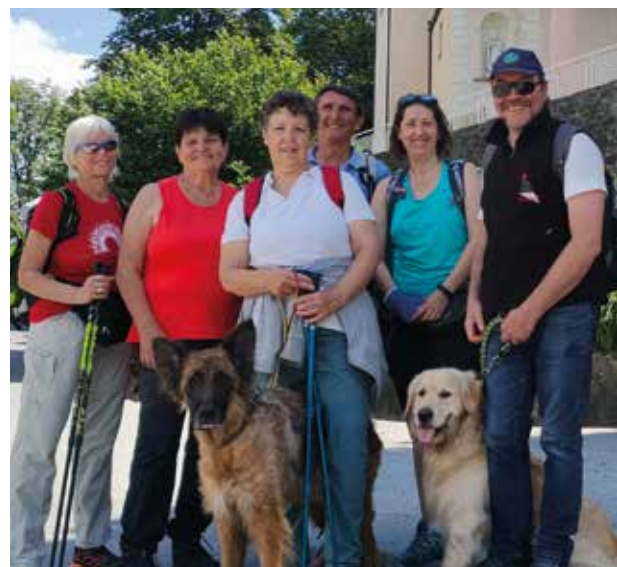
11 giugno. Escursione al Santuario di Plout.