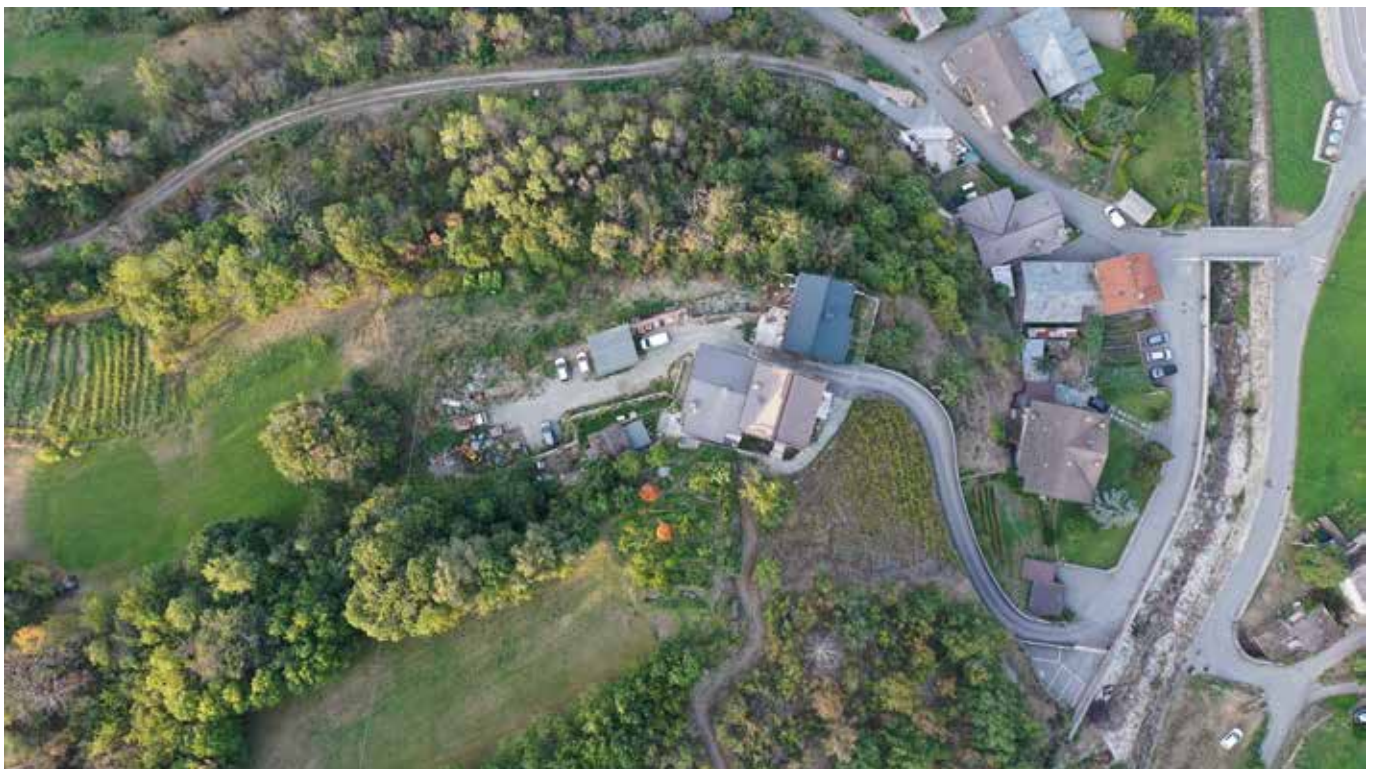
Le Pouyet. Vista dall'alto. In basso si nota la partenza del sentiero che porta alla Chiesa.

Le principali infrastrutture risalgono a metà del secolo scorso: acquedotto e fognature anni '50, strada fine anni '60.