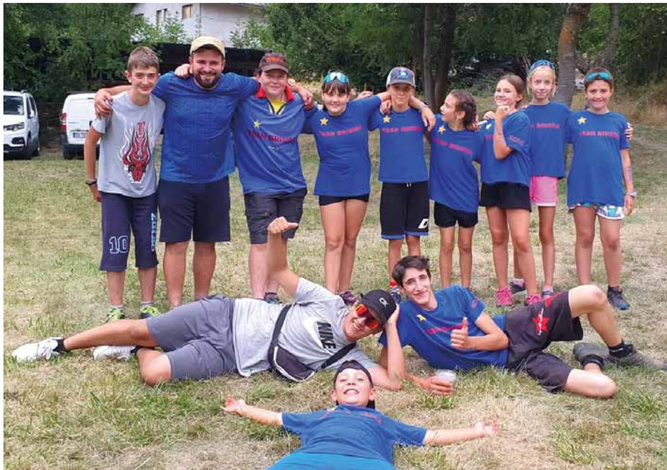
Il Brisma Juniores al Trofeo Jacopo Trèves di Emarèse.

Purtroppo quest'anno non siamo riusciti a rifare la squadra femminile, ma speriamo di raggiungere questo obiettivo nel 2024.