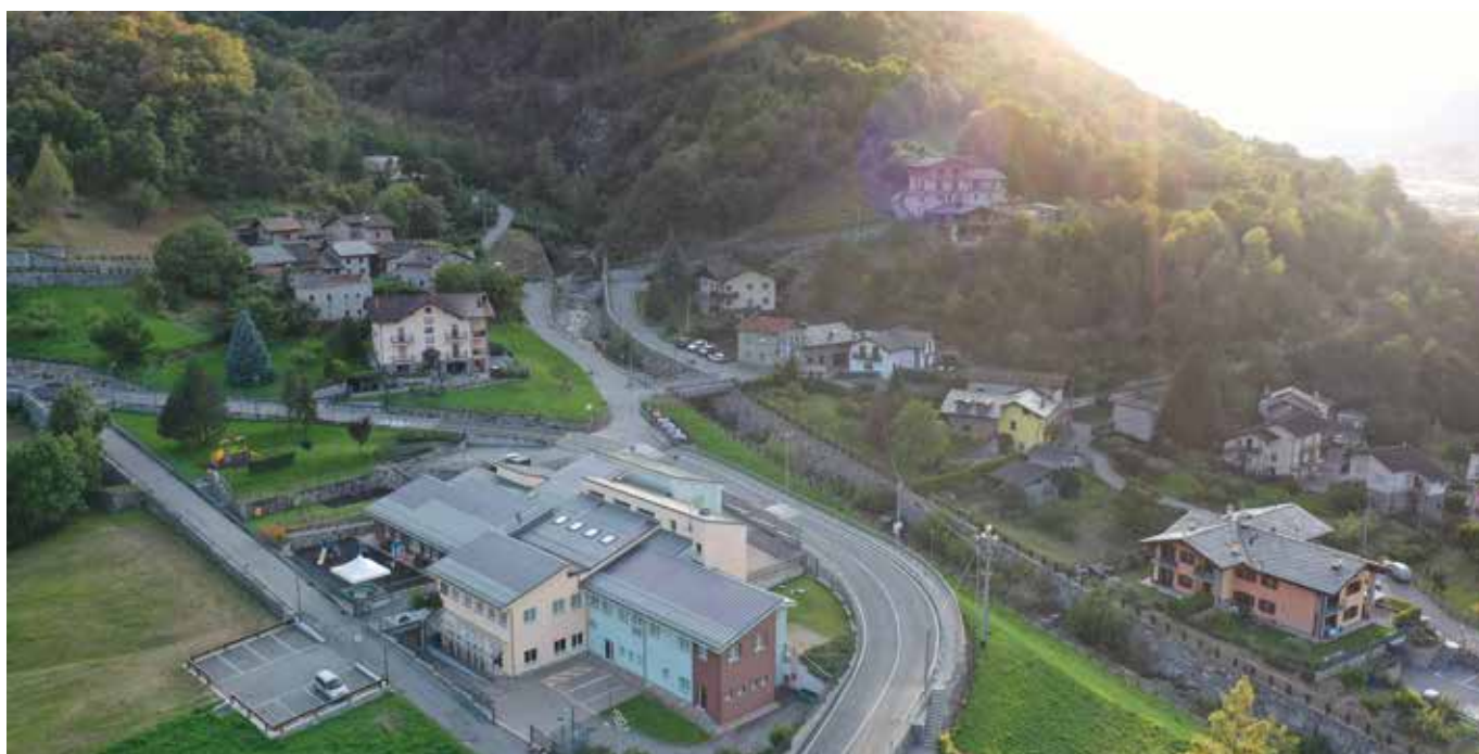
A sinistra Le Moulin, con il complesso scolastico in primo piano, a destra Établoz con Le Pouyet sullo sfondo.

Il mulino veniva utilizzato per macinare segale, frumento, mais, castagne, ecc. ed è rimasto in attività fino al 1975. La centrale idroelettrica funzionava grazie alle acque del torrente Laures e fino alla fine degli anni '60 del secolo scorso ha fornito energia elettrica all'intera comunità di Brissogne. Naturalmente il fabbisogno di energia era molto minore a quello attuale! La scuola a Le Moulin venne costruita nel 1858, proprio al centro della frazione. L'edificio è ormai in rovina, venne abbandonato alla fine degli anni '60 del secolo scorso, quando l'Amministrazione Regionale in collaborazione con l'Amministrazione Comunale fece costruire una nuova scuola. Verso la metà degli anni '70 venne chiusa la scuola di Grand-Brissogne unificando la scuola elementare. La stessa venne poi ampliata verso la fine degli anni '70, spostando a Le Moulin anche la scuola materna, che in precedenza si trovava a Neyran. Nell'edificio scolastico ha trovato posto, in quel momento, anche l'ambulatorio.