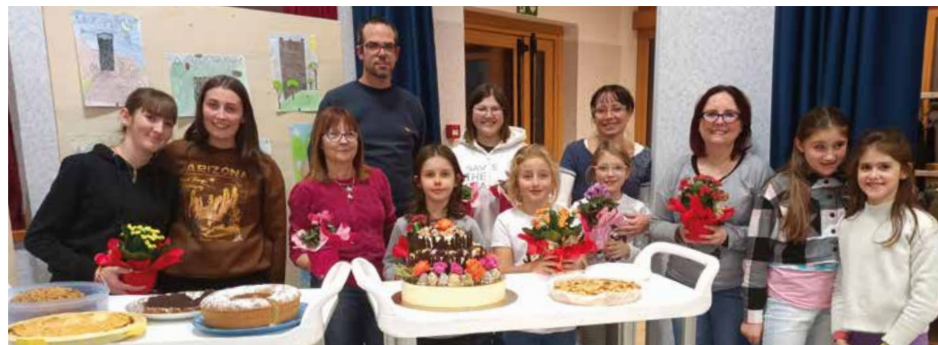
25 novembre. Festa di Santa Caterina. I partecipanti alla gara di torte.