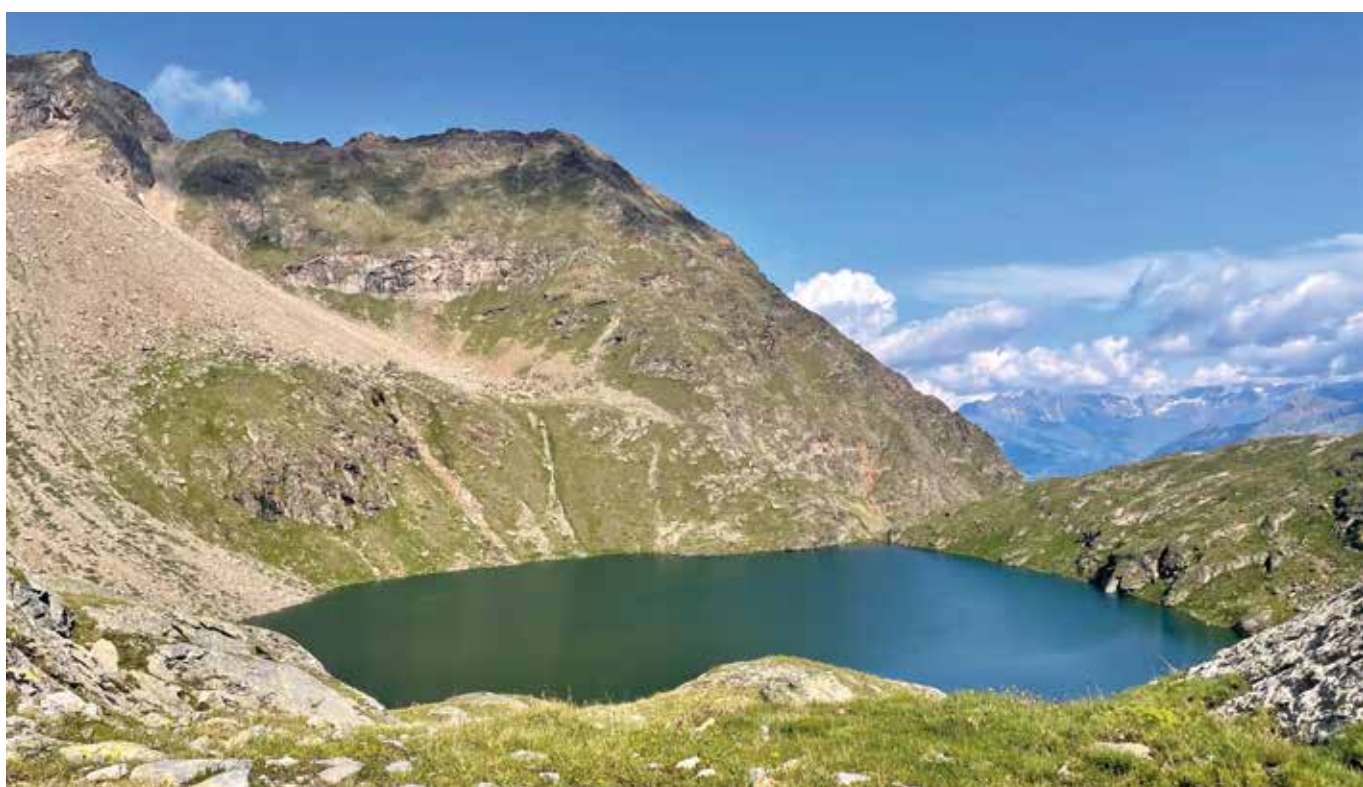
Lac des Laures.