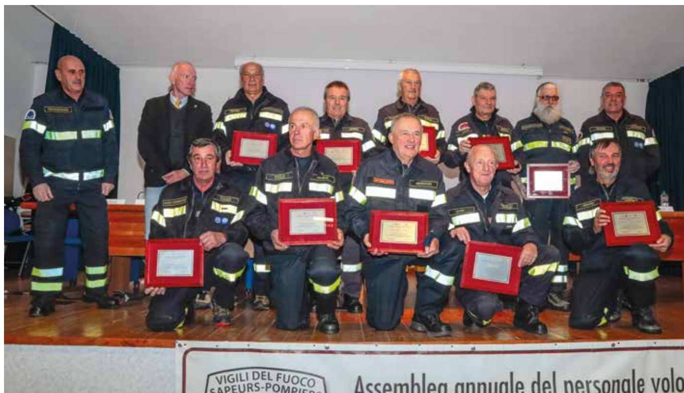
I Vigili del Fuoco Volontari premiati.

È una enorme fortuna ed un motivo di orgoglio che in questa regione ci siano così tante persone che mettono quotidianamente passione e impegno al servizio del prossimo."