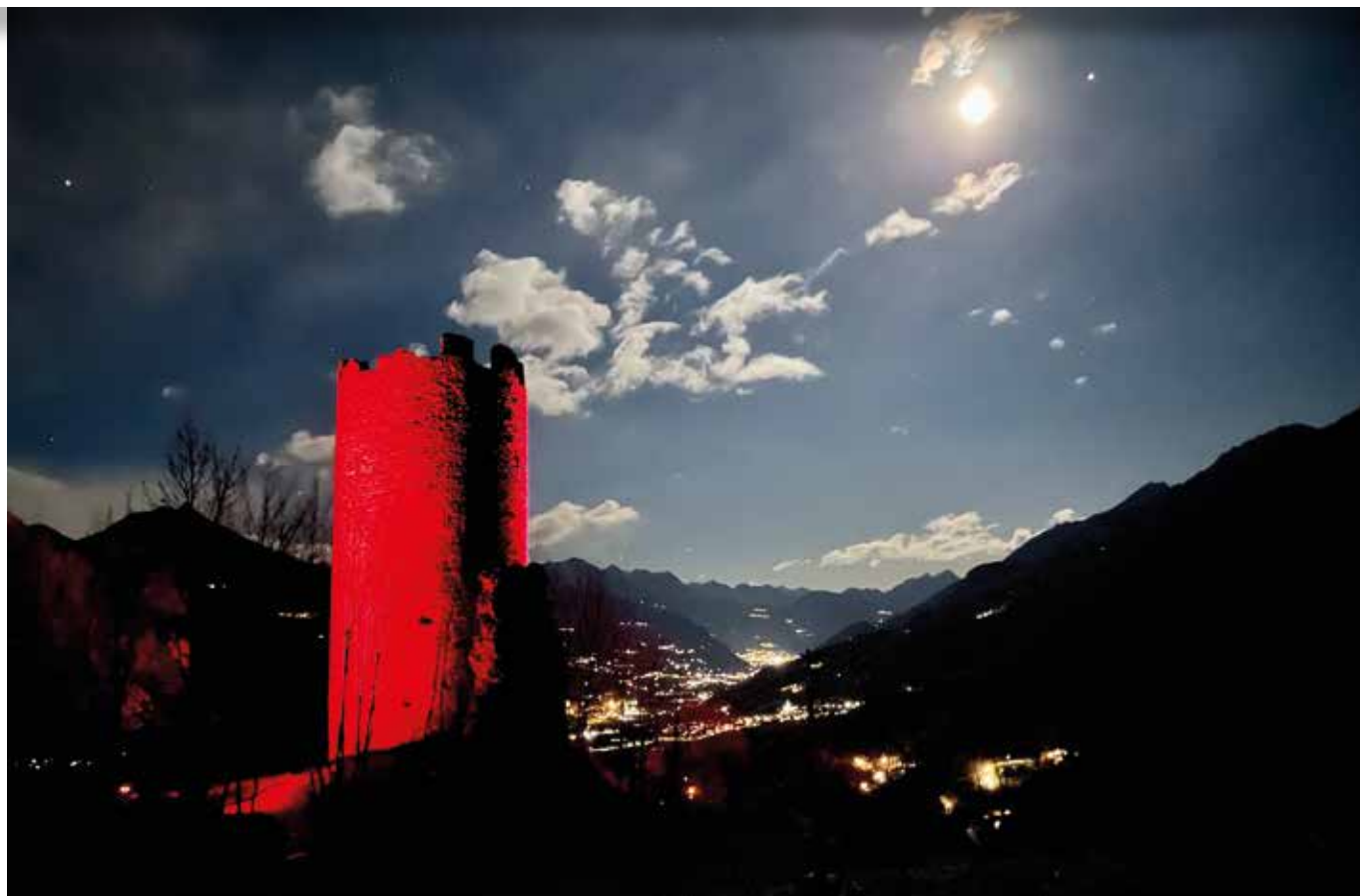
25 novembre. La Torre illuminata di rosso.