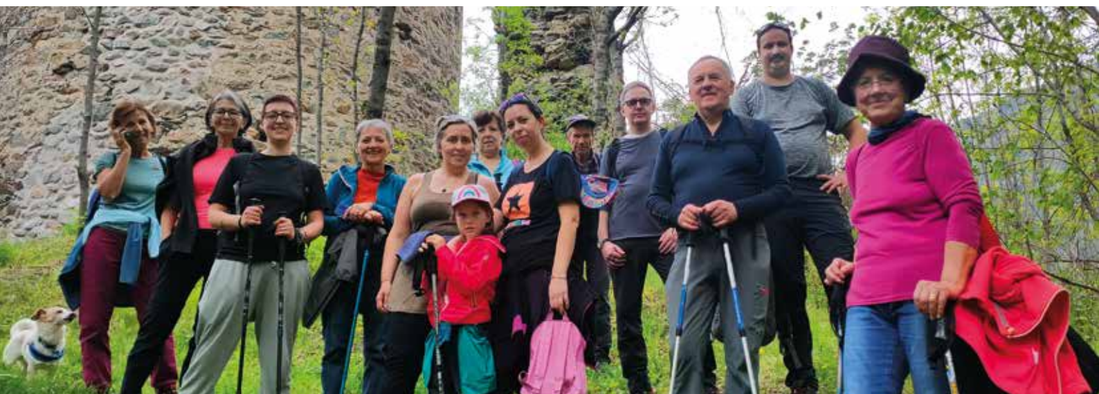
29 aprile. Gruppo di partecipanti all'escursione alla Torre.

Sabato 13 maggio, un gruppo di persone si è ritrovato a Grand-Brissogne per esplorare il sentiero che da Ayettes di Brissogne arriva in località Ayettes di Pollein. Per la maggior parte dei partecipanti questa