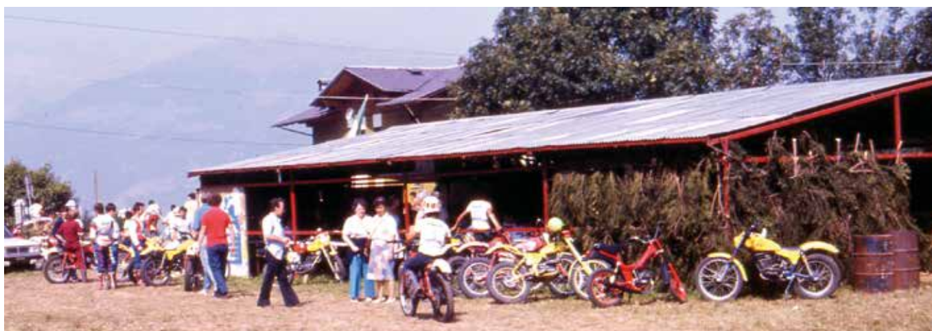
1996. 23 a Fëta de l'Oumbra. Capannone e gara di motocross.