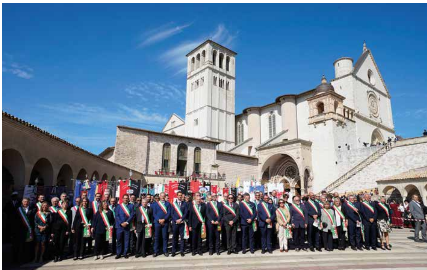
Gruppo dei Sindaci e gonfaloni alla Basilica.