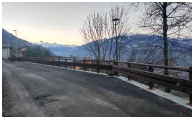
Nuovo parcheggio a Chesalet.

Sono stati appaltati ed in corso di realizzazione i lavori per la costruzione di due parcheggi rispettivamente in frazione Le Moulin e Chesalet allo scopo di dare maggiore offerta di stazionamento ai residenti. I lavori sono stati affidati al Consorzio Stabile Valle d'Aosta S.C. a r.l. con sede in Quart e che ha individuato come impresa esecutrice la ALPISCAVI srl con sede in Doues, l'importo dell'investimento è pari a 266.296,96 euro oltre ad IVA.