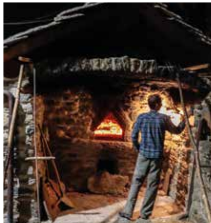
Scaldiamo bene il forno.