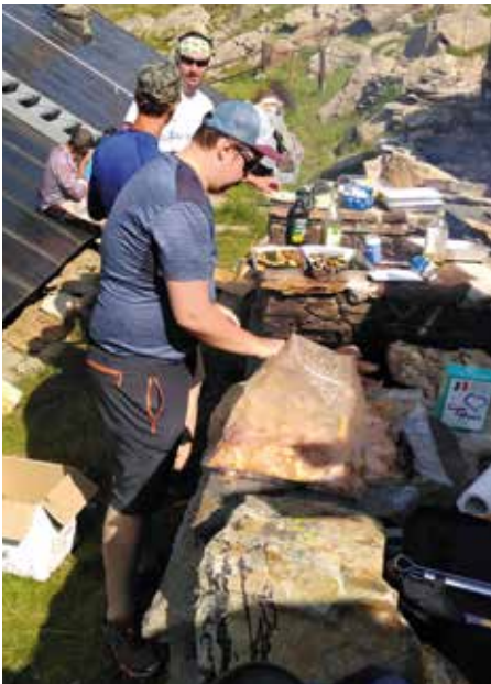
22 luglio. Festa de Les Laures. Cuochi all'opera.