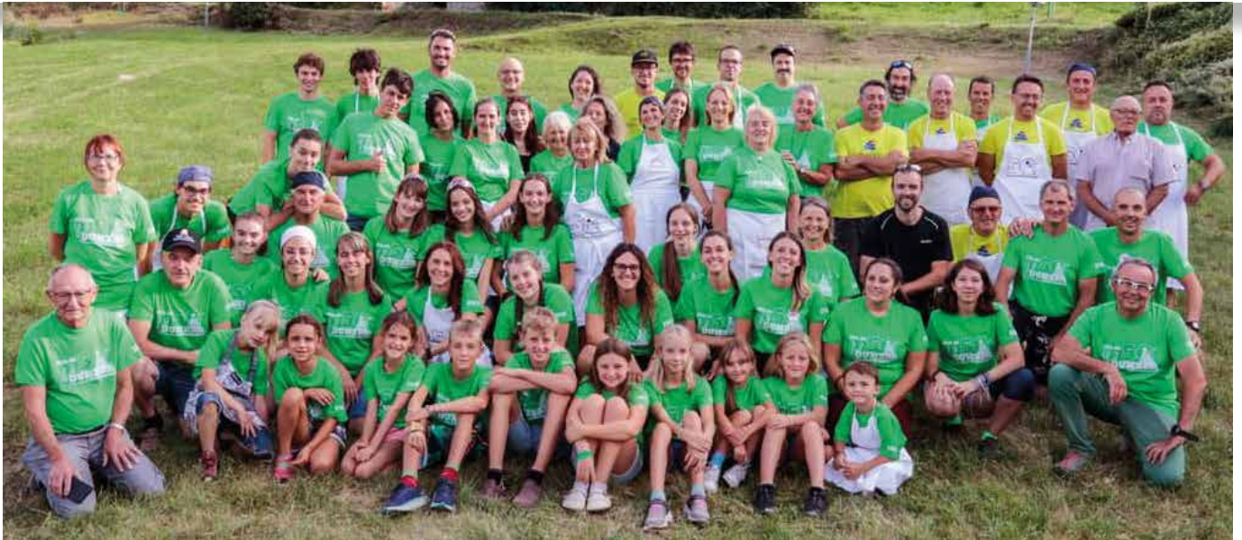
9-13 agosto. Gruppo di volontari alla Fëta de l'Ombra.