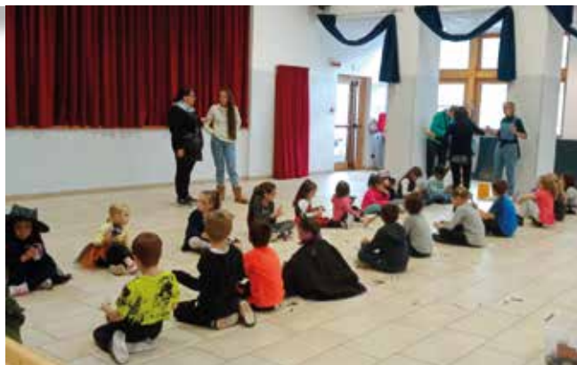
25 ottobre. Ci prepariamo per Halloween!

Il pomeriggio è poi continuato con il trucca-bimbi, giochi di gruppo guidati e golosi dolcetti!!!