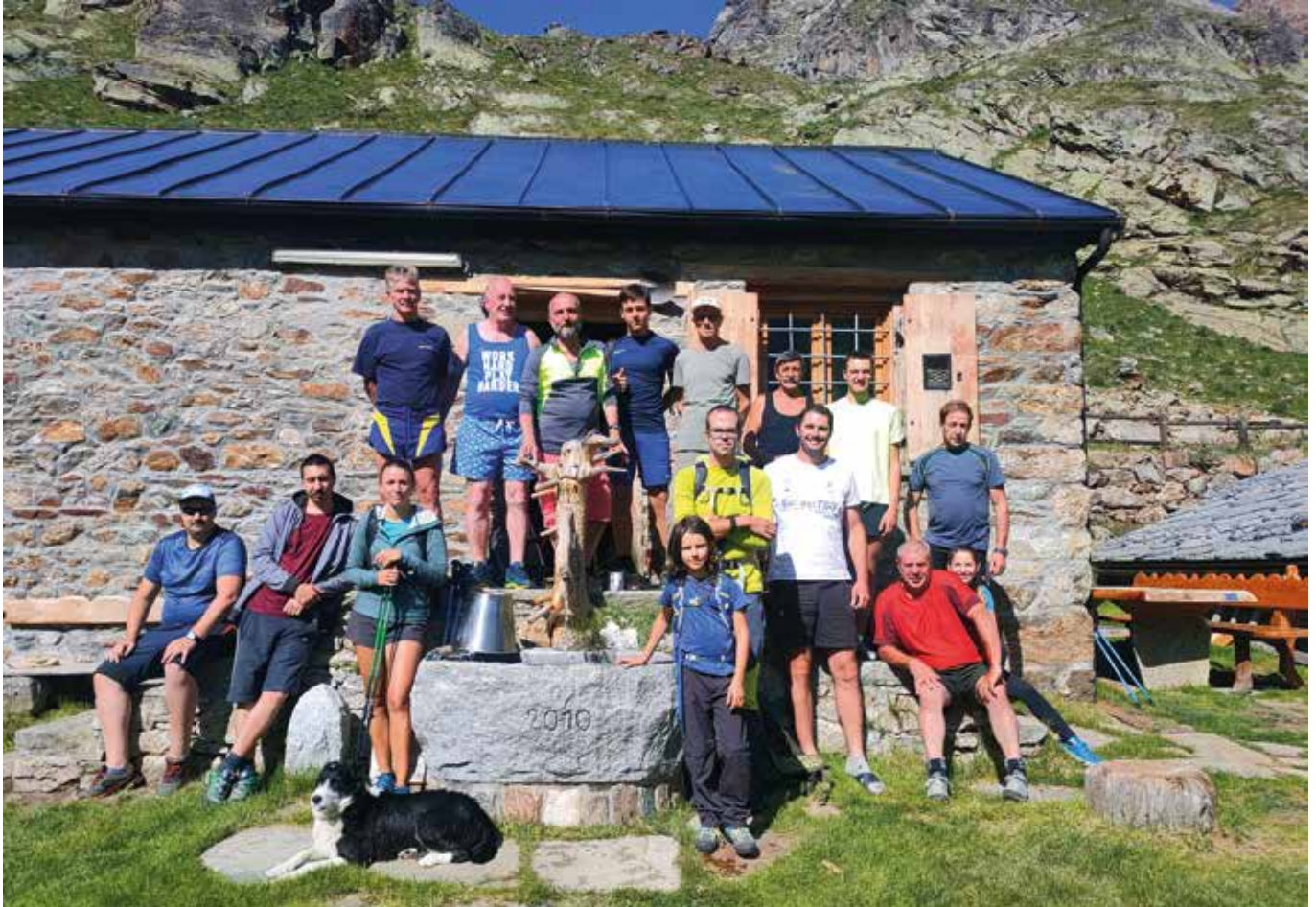
22 luglio. Gruppo alla Festa de Les Laures.