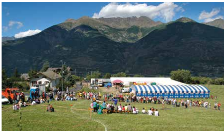
2005. La Fëta de l'Oumbra a Fontanalla.