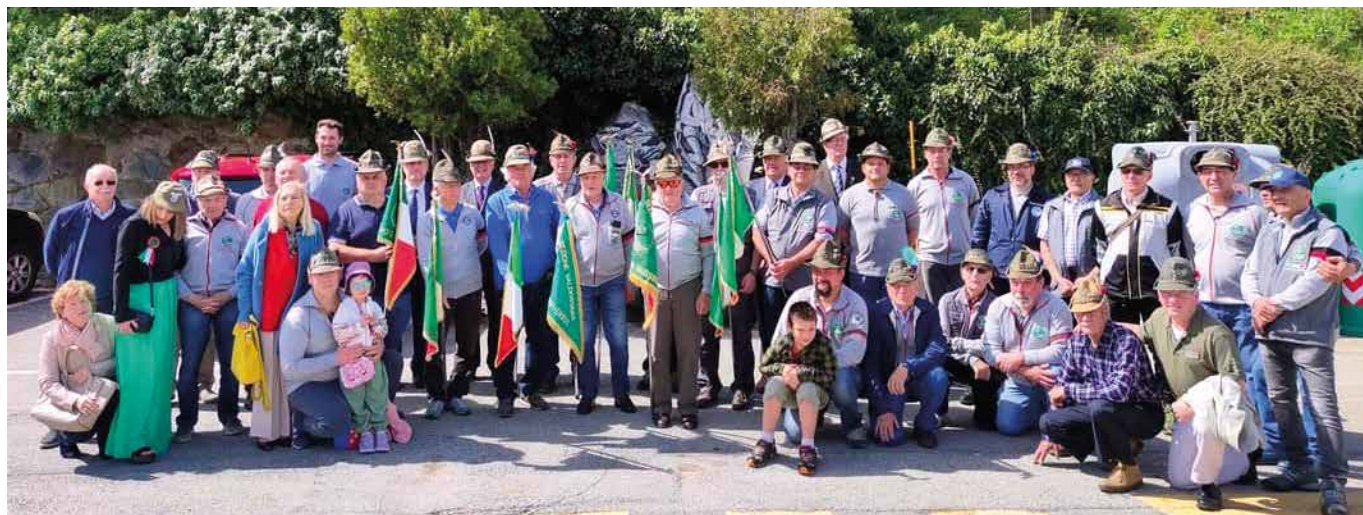
6 maggio. Gruppo alla Festa degli Alpini.

rinfresco si è poi scesi in località Pâcou dove ci attendeva il pranzo e il pomeriggio in allegria.