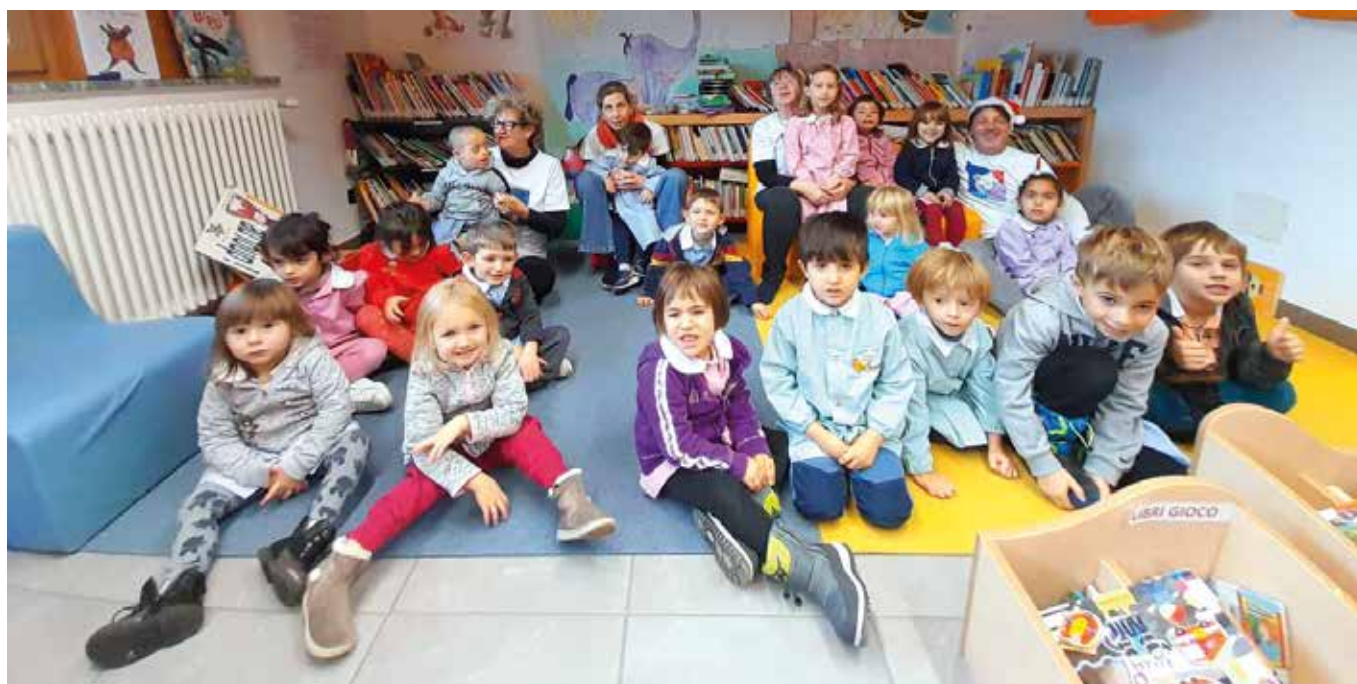
Nati per leggere.

B uon anno! I bambini della scuola dell'Infanzia di Brissogne augurano a tutti un buon inizio 2024!