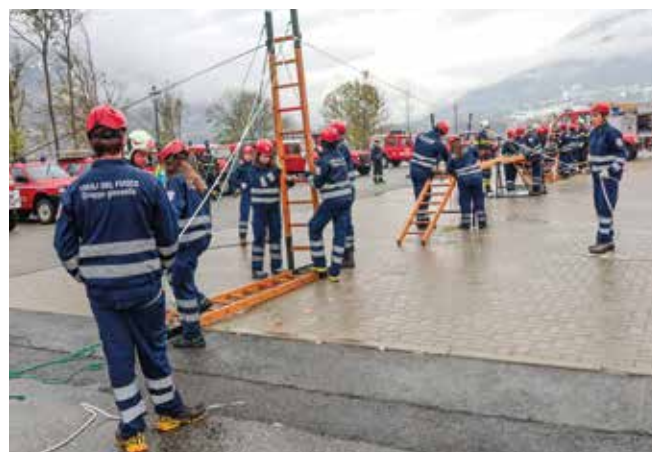
Dimostrazione dei gruppi giovanili.