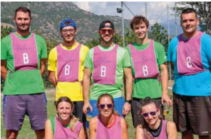
9-13 agosto. Fëta de l'Ombra. La squadra di Brissogne per i giochi senza confini.