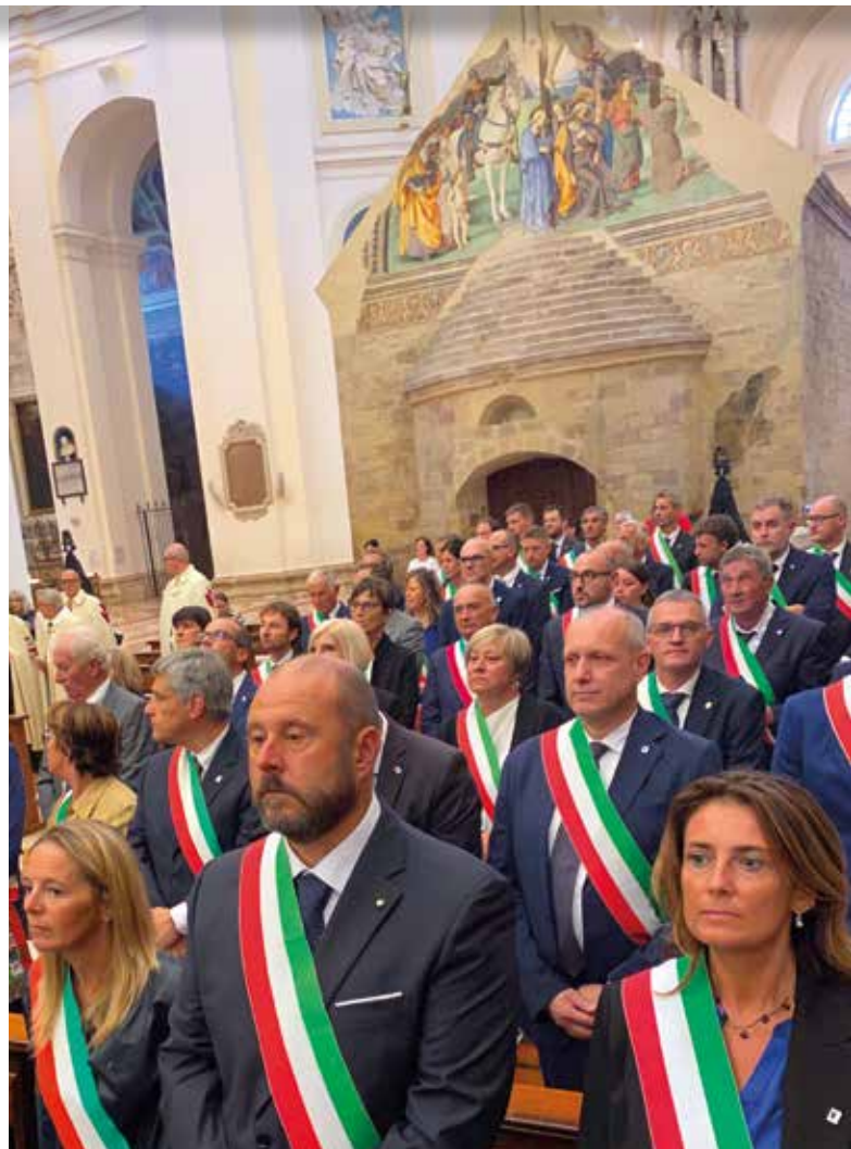
I Sindaci valdostani o loro delegati durante la cerimonia.