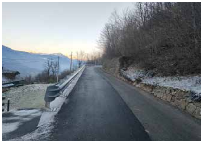
Strada di Fassoulaz.

Prosegue l'attività, da parte dell'Amministrazione Comunale, finalizzata alla messa in sicurezza delle strade comunali. Quest'anno, all'impresa DROZ srl con sede in Saint-Marcel e per un importo pari a 59.655,05 euro oltre IVA, sono stati affidati i lavori di sistema-