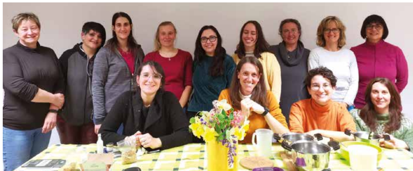
29 marzo. Laboratorio per imparare gli "Ancien Remèdes".