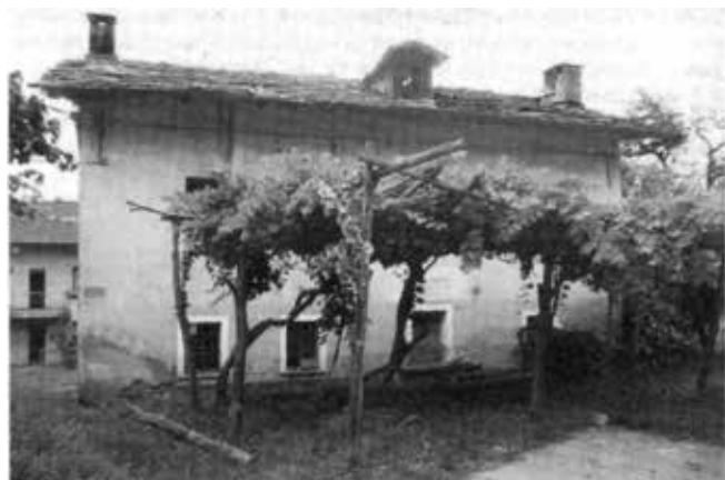
La vecchia scuola del Moulin

rio medico. Ulteriore ristrutturazione con ampliamento è stata effettuata nel decennio scorso. L'inaugurazione della nuova scuola è avvenuta il 24 ottobre 2014. Attualmente il polo scolastico conta 5 aule per la scuola primaria, due sezioni per la scuola dell'infanzia, cucina, mensa scolastica, palestra, sala multimediale, servizi igienici e aree giochi. Nel 2016 è stato costruito il nuovo parcheggio a servizio del complesso scolastico.