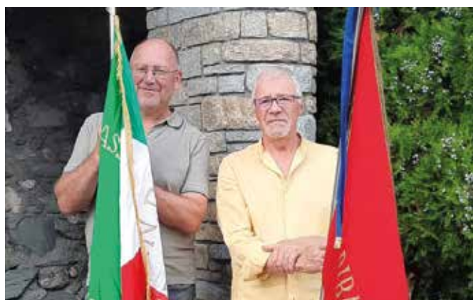
29 luglio. Commemorazione a Nus.