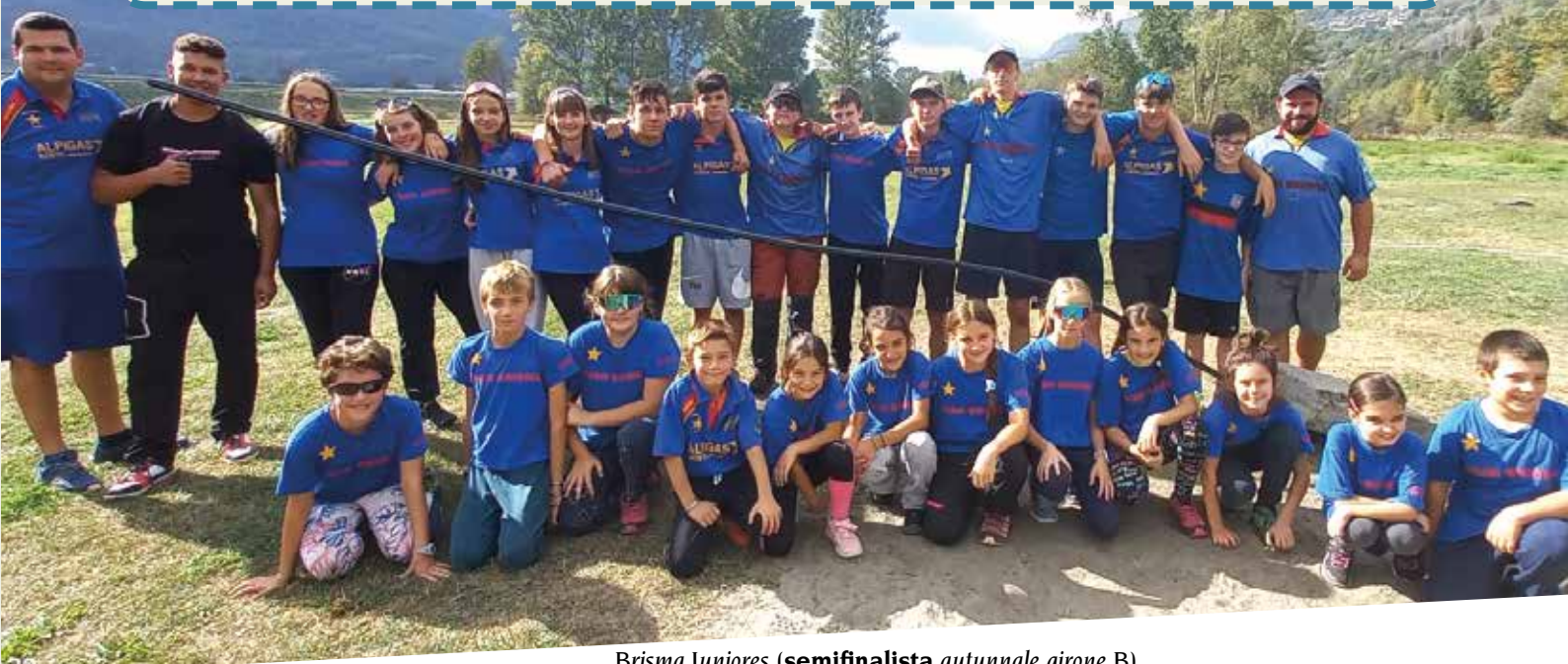
Brisma Juniores (semifinalista autunnale girone B)