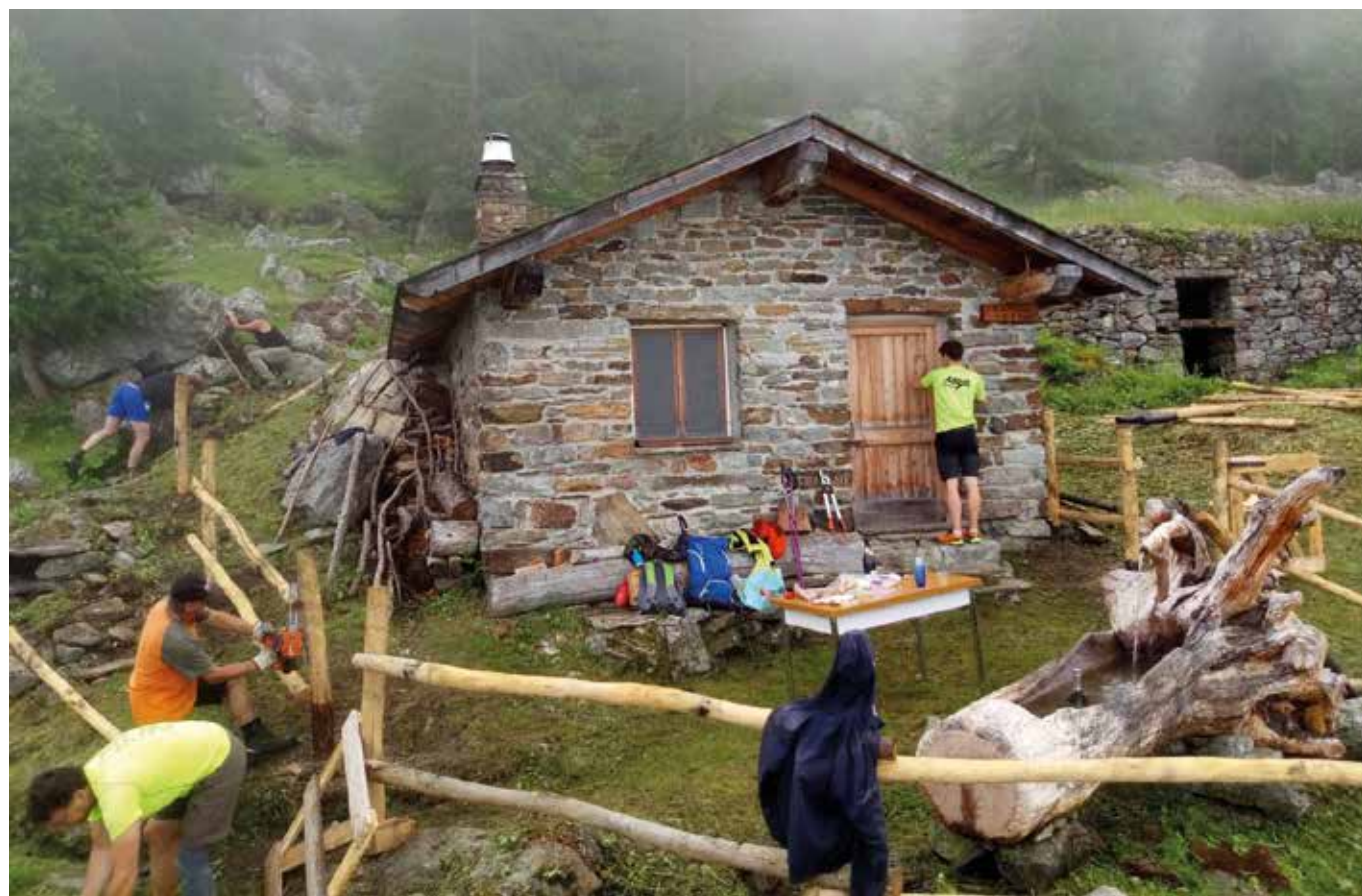
8 luglio. Corvée. Sistemazione al Tramail.

Il direttivo ringrazia tutti coloro che con la loro passione per la montagna contribuiscono al mantenimento del bivacco e del sentiero così che tutti possano beneficiare di questi luoghi magici e incontaminati dove il tempo si ferma e si può godere di ogni singolo istante.