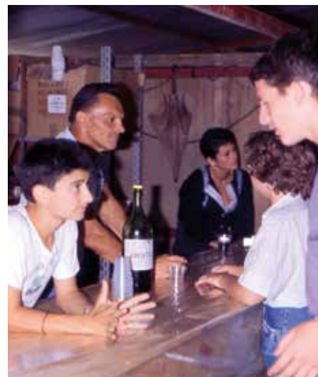
1996. 23 a Fëta de l'Oumbra. Volontari alla buvette.