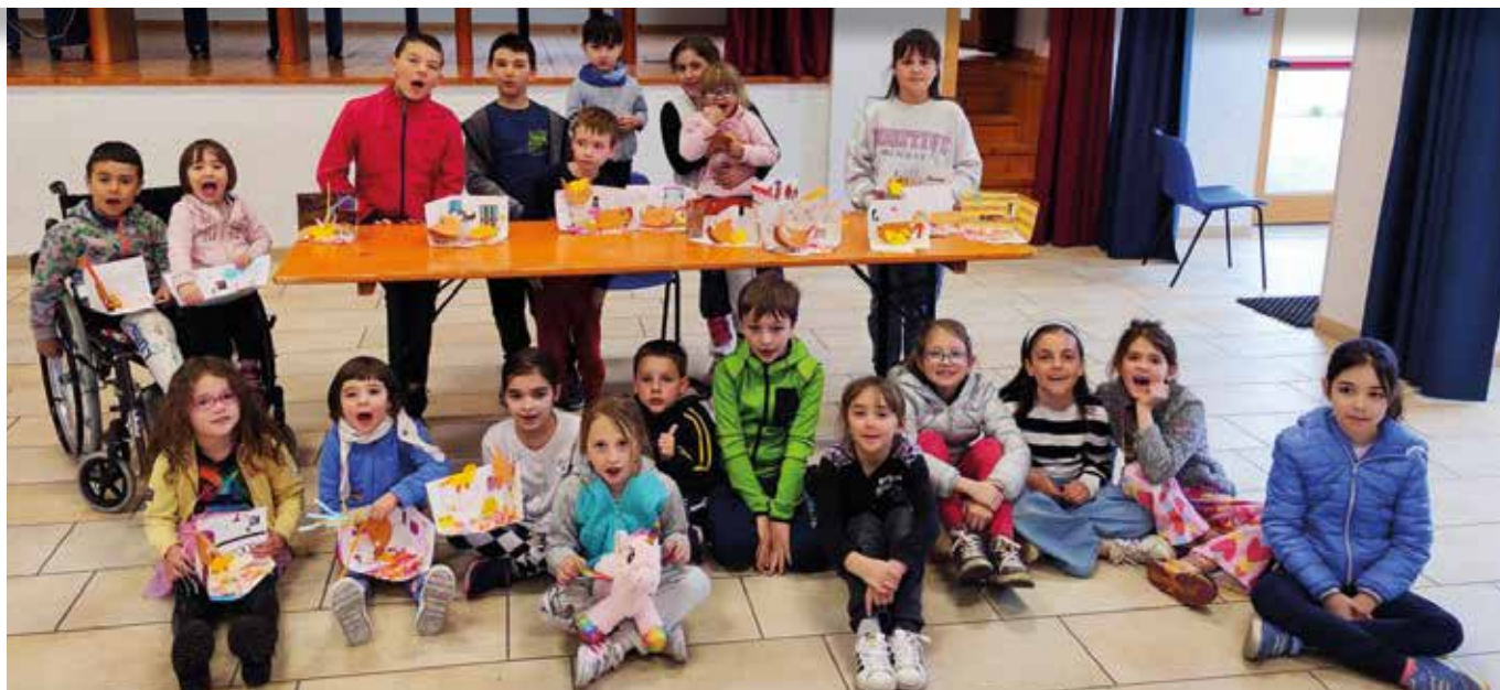
5 aprile. I bimbi al Laboratorio di Pasqua.