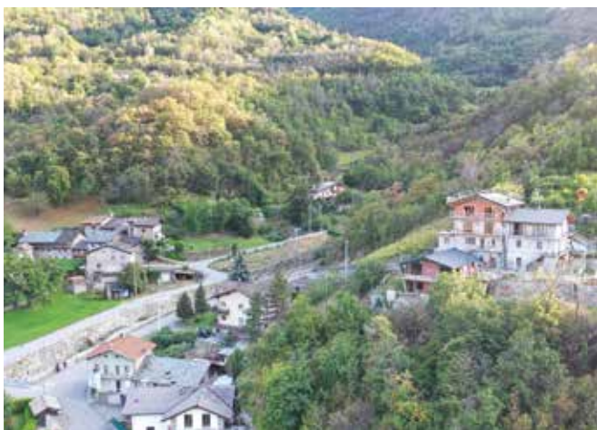
Sulla destra Le Pouyet, sulla sinistra Le Moulin.

Gli abitanti della frazione sono attualmente 7, erano solamente 2 nel 2004, mentre risultano 6 residenti nel censimento del 1814 e nessuno nel 1801.