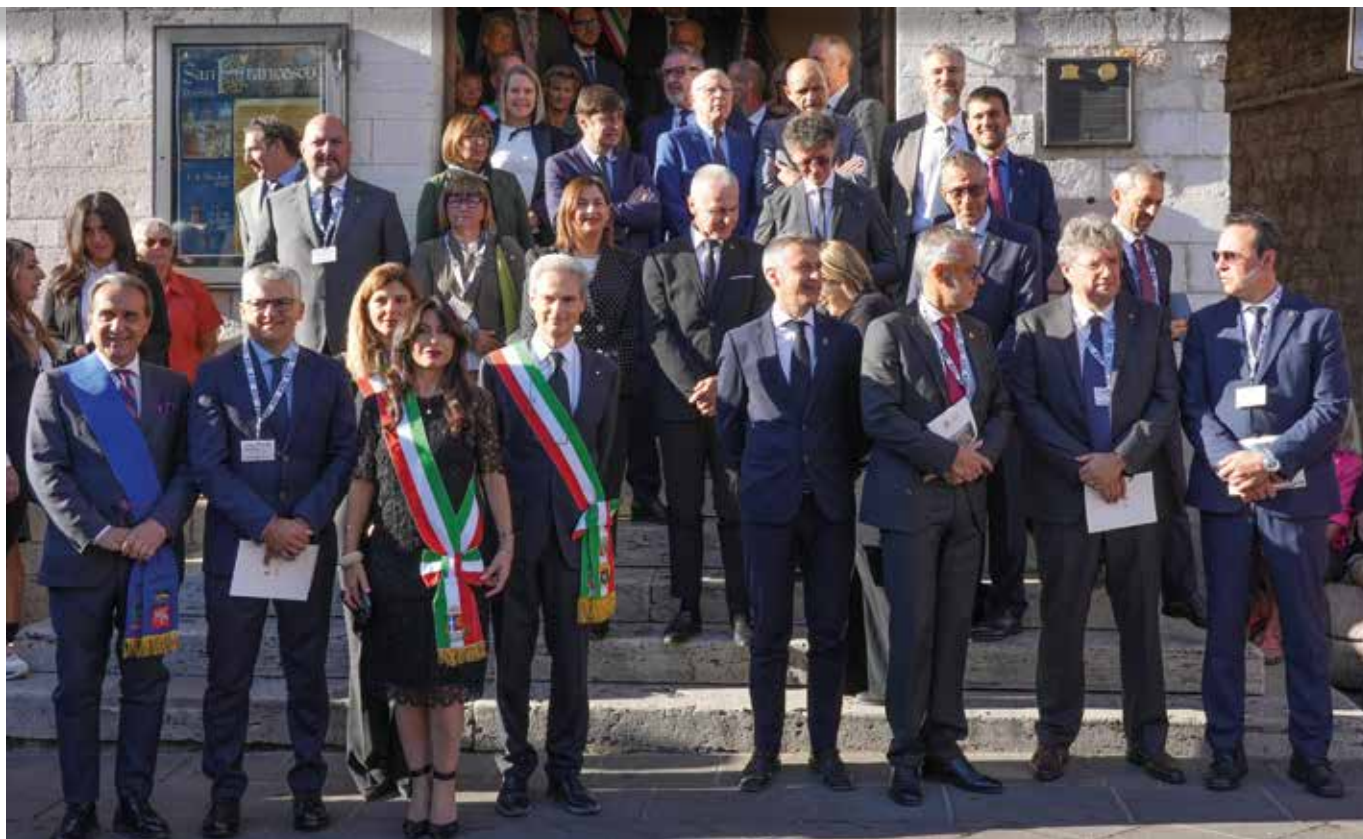
Le autorità valdostane.