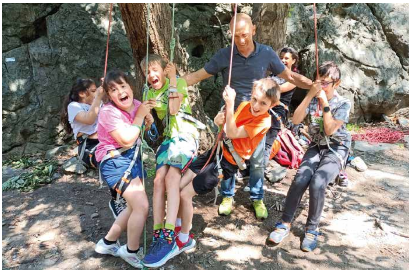
Che divertente la palestra di roccia di Pontey!

Per la gita finale siamo andati a Morgex dove i più piccoli hanno visitato la Tour de l'Archet, mentre i grandi, guidati da un attore professionista, hanno improvvisato delle scenette nel Parco della Lettura.