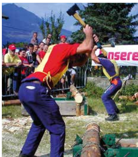
2003. Fëta de l'Oumbra. Triathlon del boscaiolo.