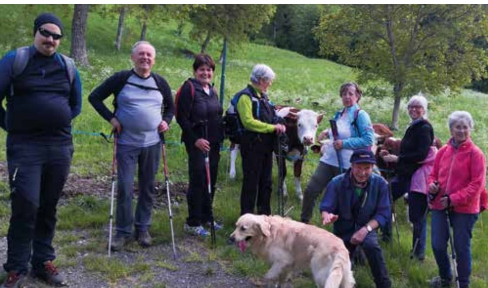
13 maggio. Escursione ad Ayettes