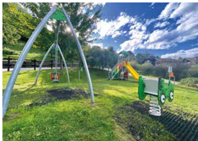
Nuove attrezzature del parco giochi a Luin.

zione di un tratto della strada a ridosso della frazione Fassoulaz con rifacimento di un tratto di muro in pietra e malta e relativo cordolo con sicurezza.