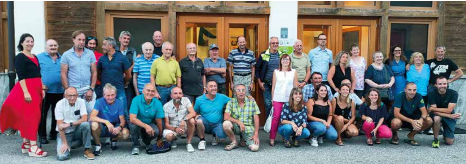
Agosto. Gruppo alla cena dei direttivi per i 50 anni della Pro Loco.