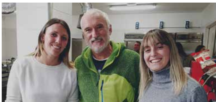
25 novembre. Festa di Santa Caterina. La giuria della gara di torte.