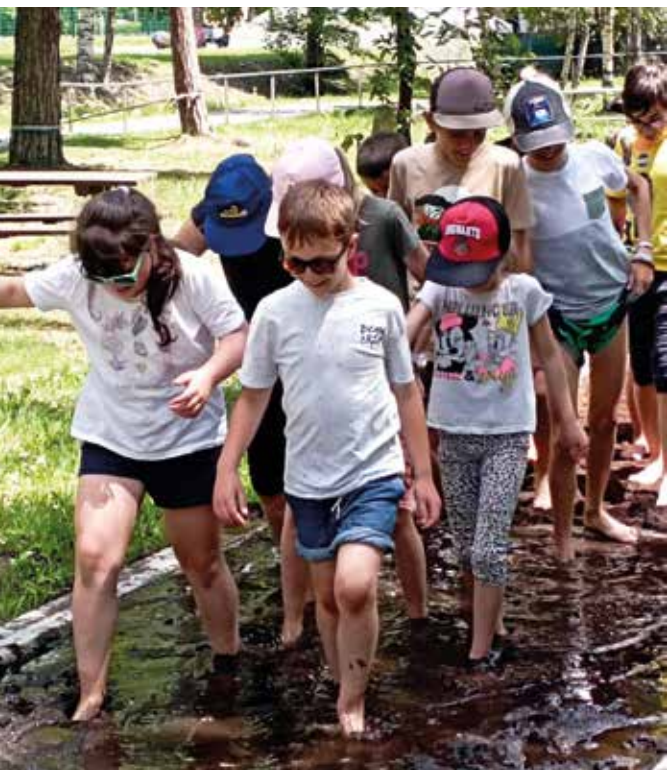
Che bello il percorso sensoriale!