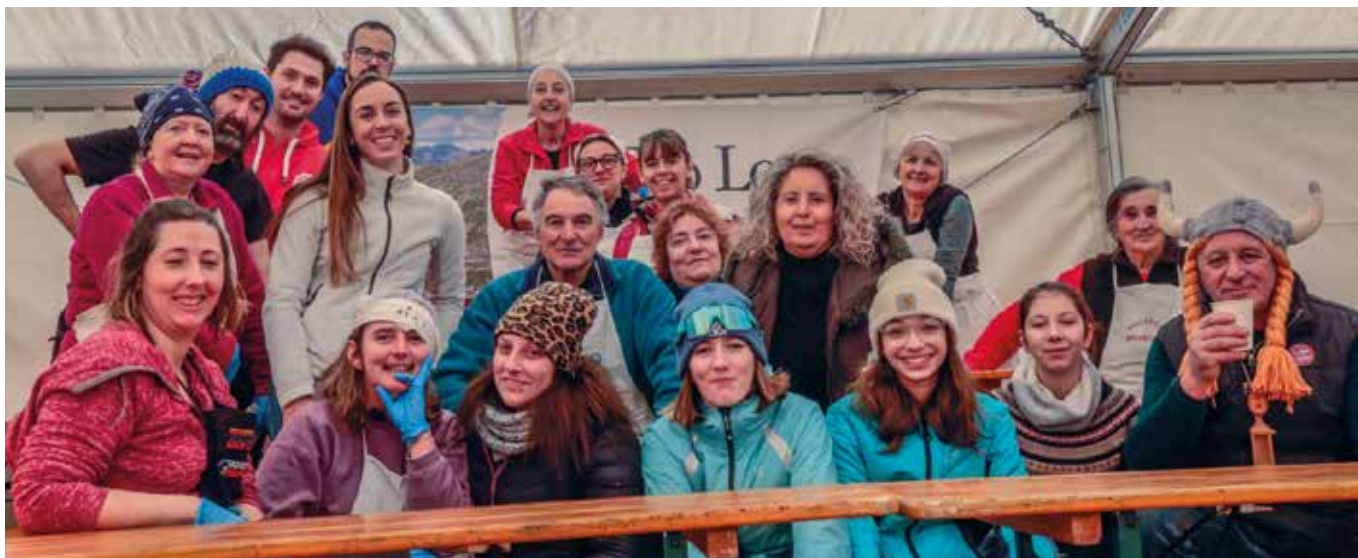
30-31 gennaio. Gruppo di volontari al Punto Rossonero.

Il 28 ottobre presso il salone polivalente di Pâcou si è svolta l'annuale Castagnata organizzata dalla Pro Loco. Nel pomeriggio distribuzione delle caldarroste, cotte dai nostri preziosi volontari e a seguire un ricco casse-croûte per chi ha voluto passare una serata in compagnia. Quest'anno per la prima volta, è