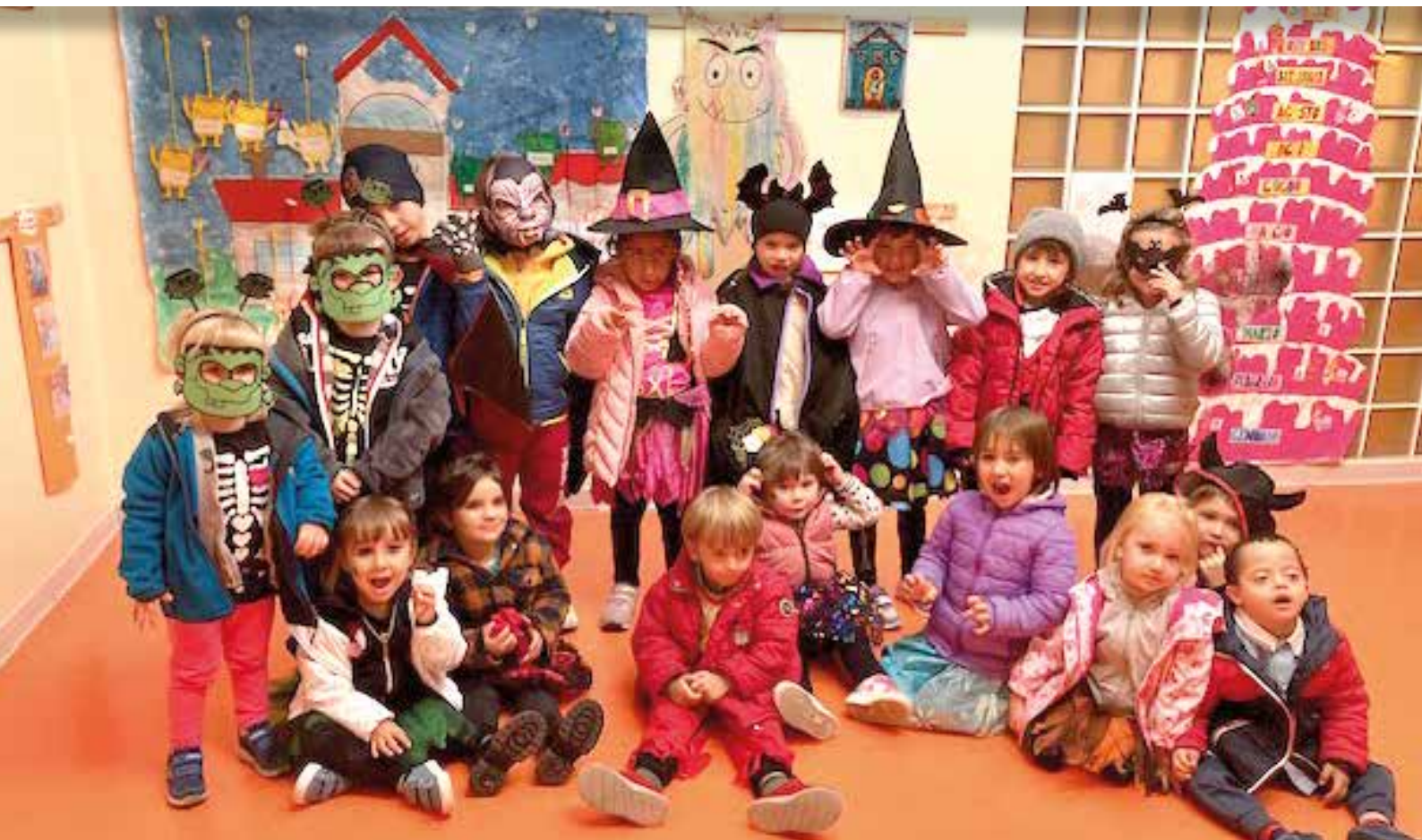
Halloween. Vi facciamo un po' paura?