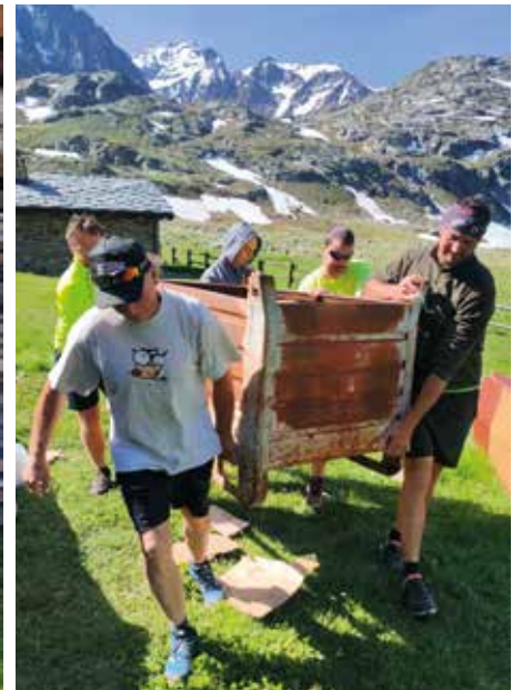
22 luglio. Festa de Les Laures. Sempre al lavoro!