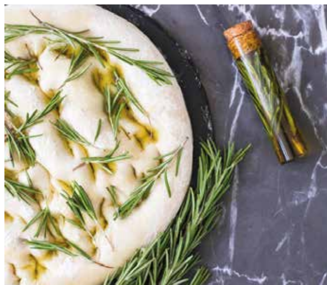
Focaccia con rosmarino.

In Sardegna ne esiste una tipologia dai fiori bianchi e viene utilizzato per cucinare pietanze a base di agnello. In Toscana i suoi aghi, invece, sono l'ingrediente essenziale per il castagnaccio, il tipico dolce autunnale a base di farina di castagne.