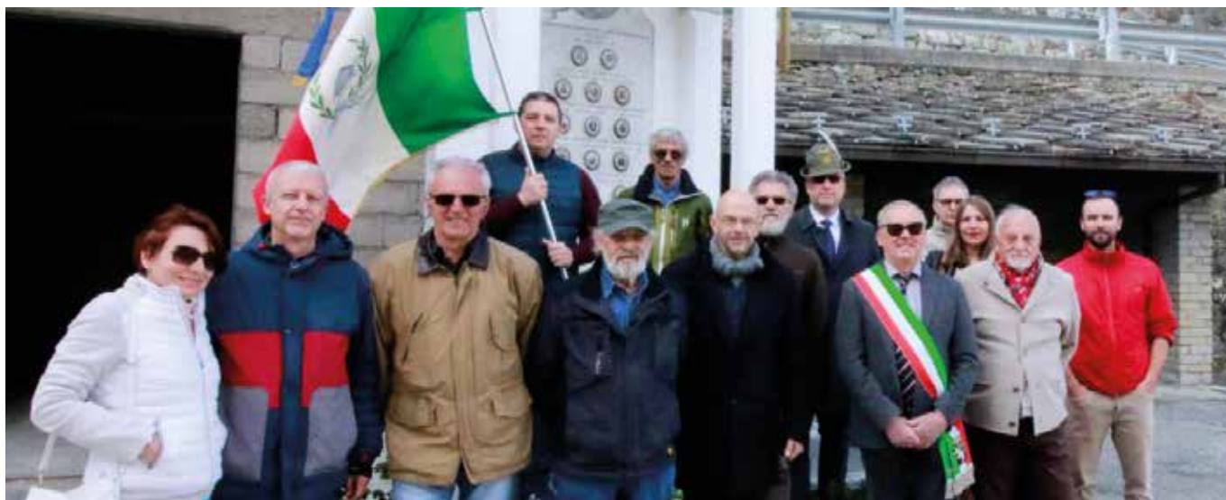
25 aprile. Gruppo alla commemorazione dei caduti.

Ricordiamo che il territorio di Fénis ha ospitato la prima banda partigiana organizzata in Valle d'Aosta per