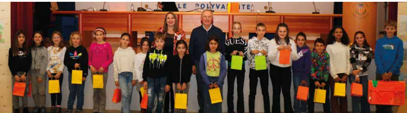
24 novembre. I bambini premiati per il concorso "La Tornalla".