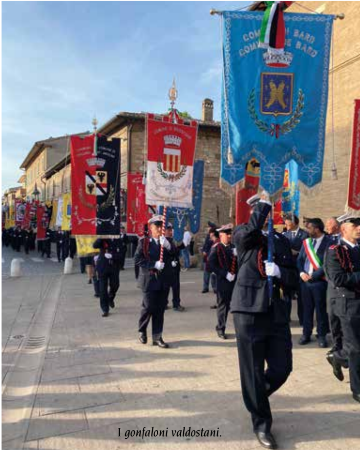
I gonfaloni valdostani.

si potevano ammirare le esibizioni allietanti del gruppo folcloristico del Comité des Traditions Valdôtaines.