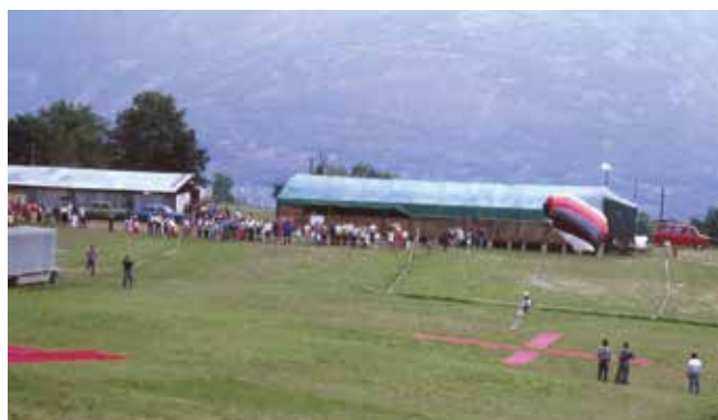
Anni '80-'90. Fëta de l'Oumbra. Esibizione paracadutisti.

A Pâcou nasce successivamente il centro polivalente comunale che oggi tutti noi conosciamo bene, ospitante tante strutture destinate alla popolazione. Nei cinque giorni della Fëta, a partire dal 2009 l'area diventa il cuore del nostro comune. Ancora il grande lavoro di chi allora si è impegnato a configurare il nostro padiglione e le cucine del grill perfettamente adattate alle strutture fisse del centro polivalente