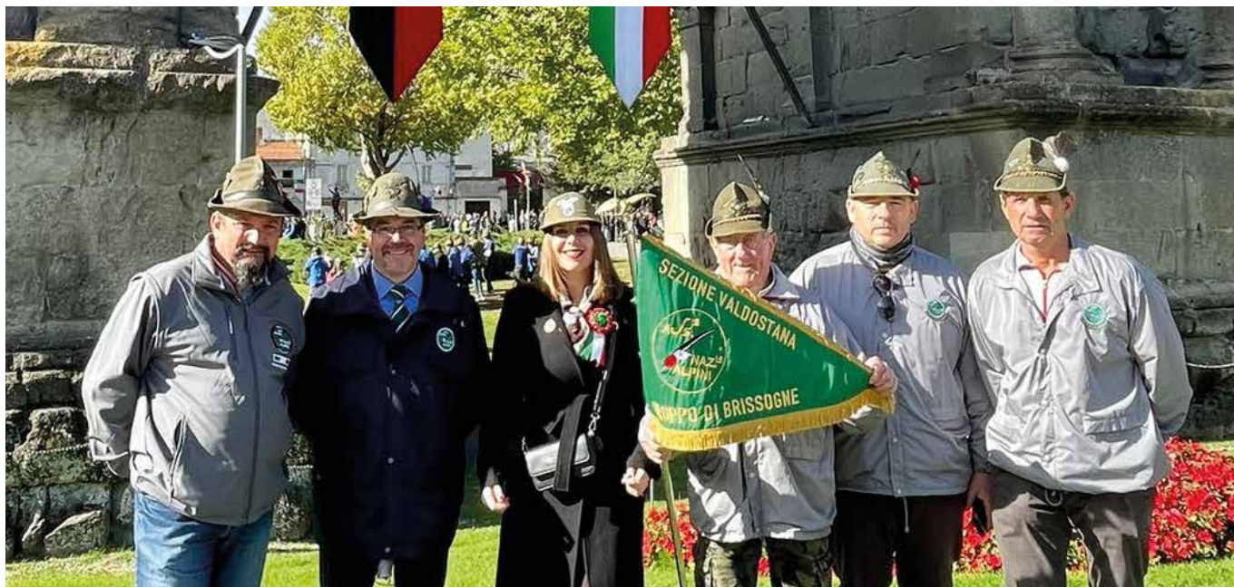
Il Gruppo Penne Nere di Brissogne presente alla sfilata per il Centenario.

tasi da noi, durante una manifestazione ad Aosta di staffetta organizzata dall'EdilEco e altri eventi locali. Il nostro supporto quindi non è mancato e chi ha potuto ha dato il suo contributo, cosa molto importante che dimostra che come Gruppo ci siamo. Mi-