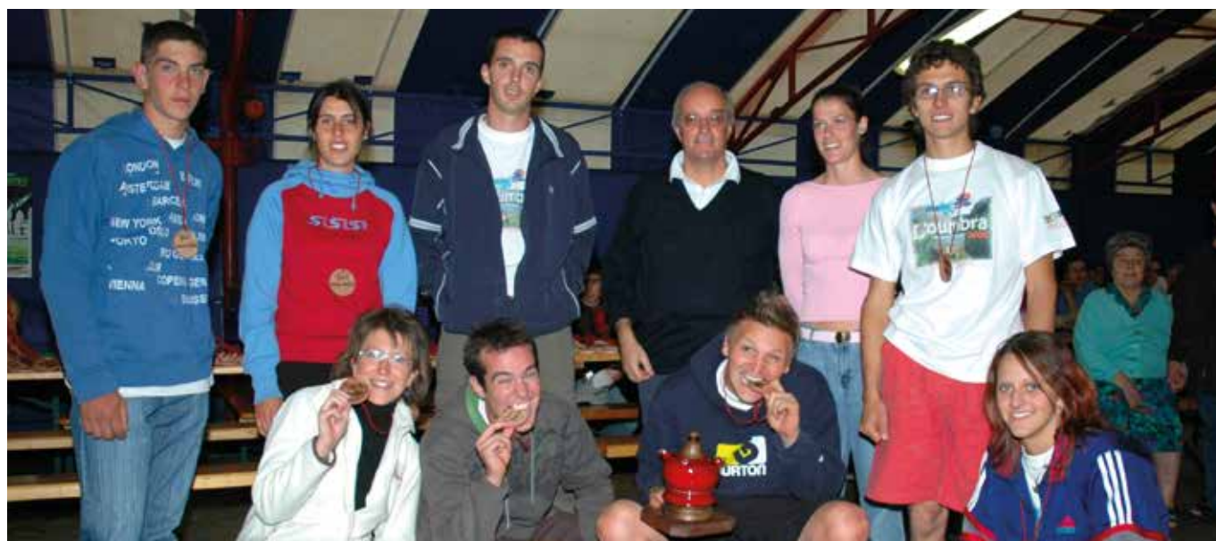
2006. Fëta de l'Oumbra. Giochi senza confine. La squadra di Brissogne con la campionessa olimpica di short track Mara Zini, all'epoca nostra concittadina.

E ora lo sguardo avanti; le difficoltà cambiano, oggi sono forse più quelle "amministrative", ma la voglia di non farsi scoraggiare e continuare in questo imponente lavoro di organizzazione necessita forzatamente di nuove risorse. Per fortuna ogni anno tanti volti nuovi si stanno avvicinando al "dietro le quinte" della festa, dando energie e coraggio anche ai "vecchi" per non rendere vano il lavoro di chi ha dato vita e tramandato la festa. Viva la Fëta de l'Oumbra!!