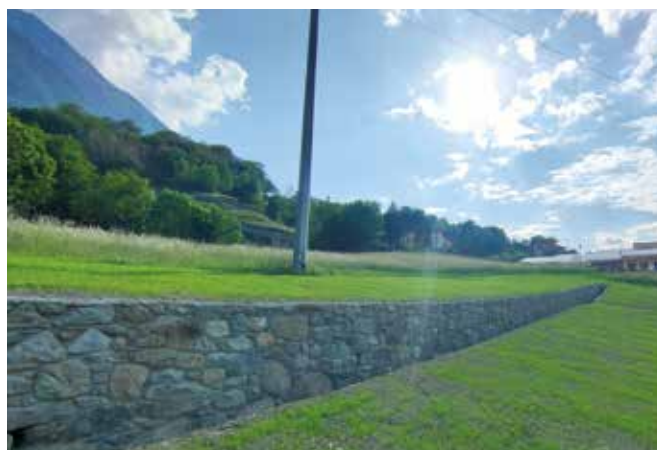
Rû Moulin sistemato.

Nell'ambito della collaborazione con l'Amministrazione Regionale, quest'anno la R.A.V.A. è intervenuta sul nostro territorio con diversi lavori. In particolare i cantieri forestali hanno permesso la messa in sicurezza idraulica del rû Seigneur in loc. Grand-Banc e la sistemazione del rû Moulin compreso il rifacimento di un tratto di muro di sostegno in frazione Neyran-Dessus. La Regione è inoltre intervenuta per l'asfaltatura di alcuni tratti sulla S.R. n. 15. Infine sono stati predisposti e messi in vendita alcuni lotti di legname derivanti da taglio su particelle comunali per un totale di circa 160 metri cubi.