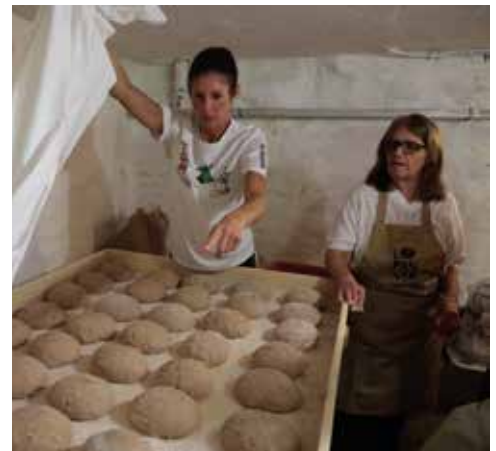
Pronti da infornare!

Tutti i volontari hanno permesso come per gli anni passati, di realizzare una giornata che riecheggia di tradizione ma anche di innovazione e di sperimentazione che unendosi formano la magia del pane nero. Lé-z-amì di Pan Nèer, quindi, vi aspettano il prossimo anno per festeggiare ben 20 anni di tradizione!!!