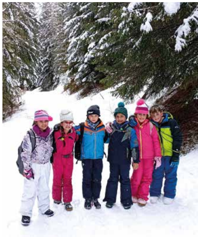
La classe terza a Pila.

Su invito dell'Amministrazione Comunale abbiamo fatto una bella passeggiata fino alla Torre di Brissogne percorrendo la ripida mulattiera; successivamente i bambini hanno raffigurato la Torre per partecipare al Concorso per il miglior disegno.