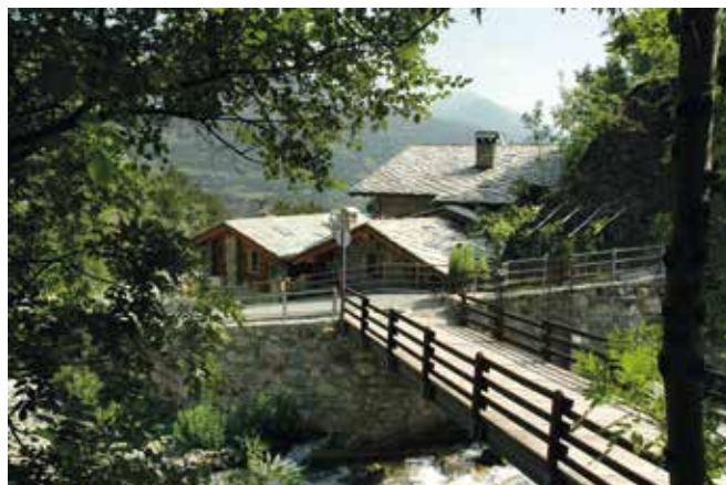
Le Moulin. Il ponte più a monte con la casa di Aldo Champion completamente ricostruita dopo l'alluvione del 2000.

Gli abitanti attuali della frazione sono 18, erano 14 nel 2004, risultavano 3 nel censimento del 1801, mentre erano saliti a 15 in quello del 1814.