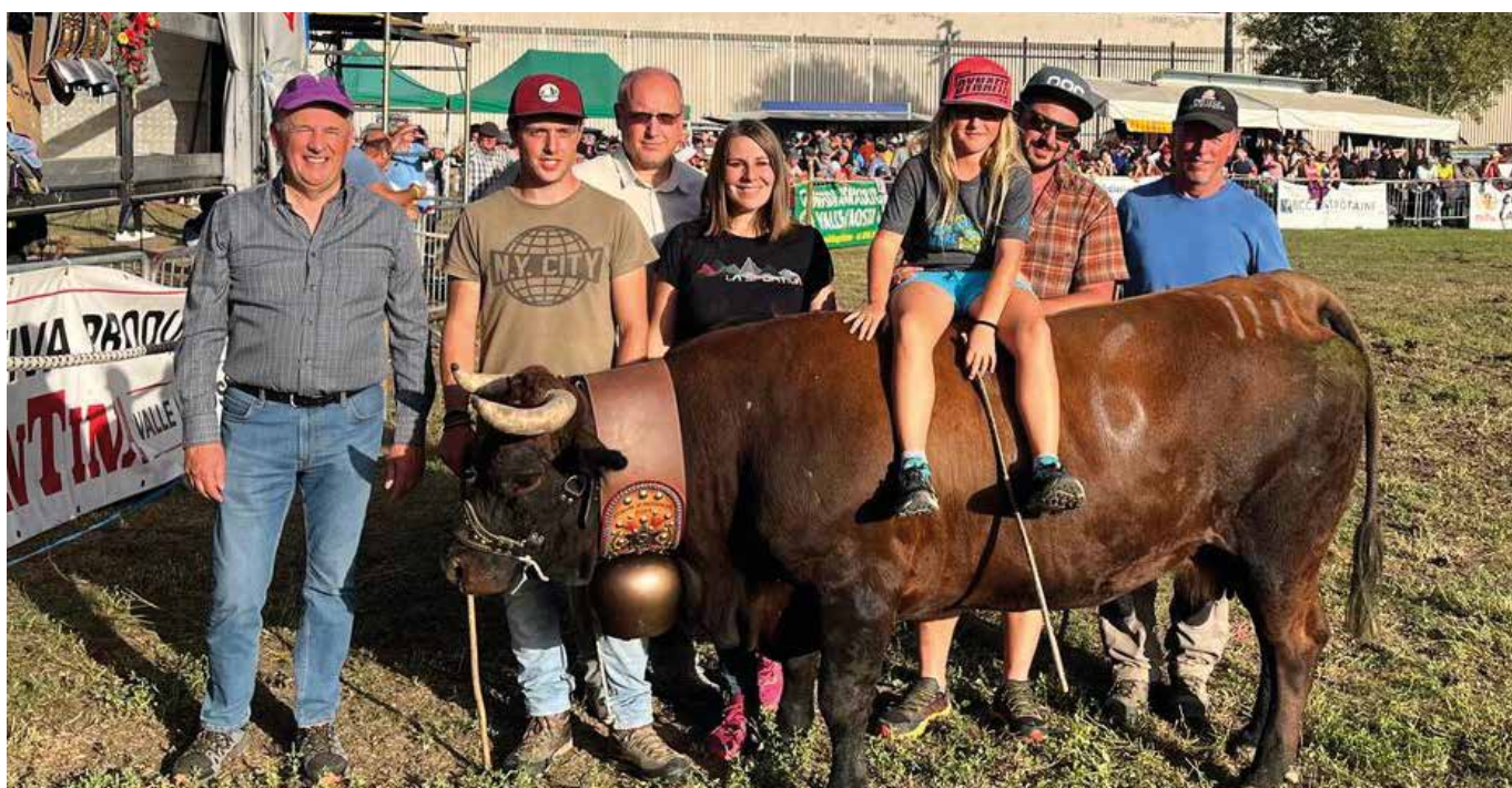
La famiglia Minuzzo con la campana offerta dall'Amministrazione Comunale.