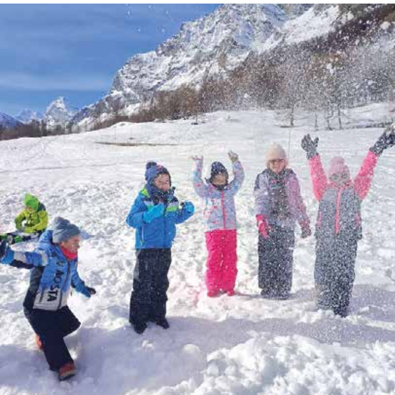
Giochiamo con la neve a Rhêmes-Notre-Dame!

Il momento più divertente però, è stato sporcarsi i piedi nel percorso sensoriale!