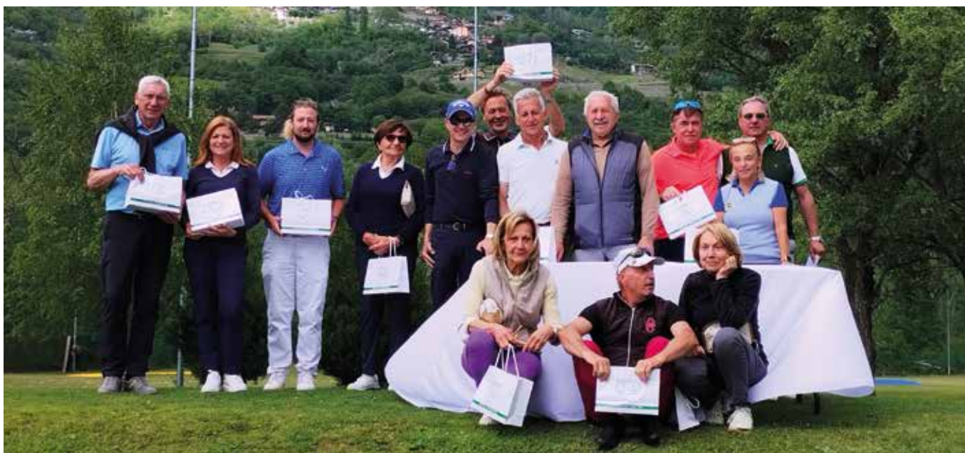
Premiazione della Coppa Reverchon.

«Per iniziare conviene prendere qualche lezione con un maestro, per impostare bene il movimento da fare, altrimenti si prendono "cattive abitudini" ed è difficile poi correggersi. Si paga una tessera federale ed è necessario sostenere un esame orale sulle regole del golf per poter entrare in qualunque campo. Per quanto riguarda l'associazione al Golf Club, per i residenti nel nostro comune, il Golf Club Aosta Brissogne applica il 30% di sconto. Bisogna procurarsi le mazze (14 bastoni in tutto, tra legni, ferri, drive e put)