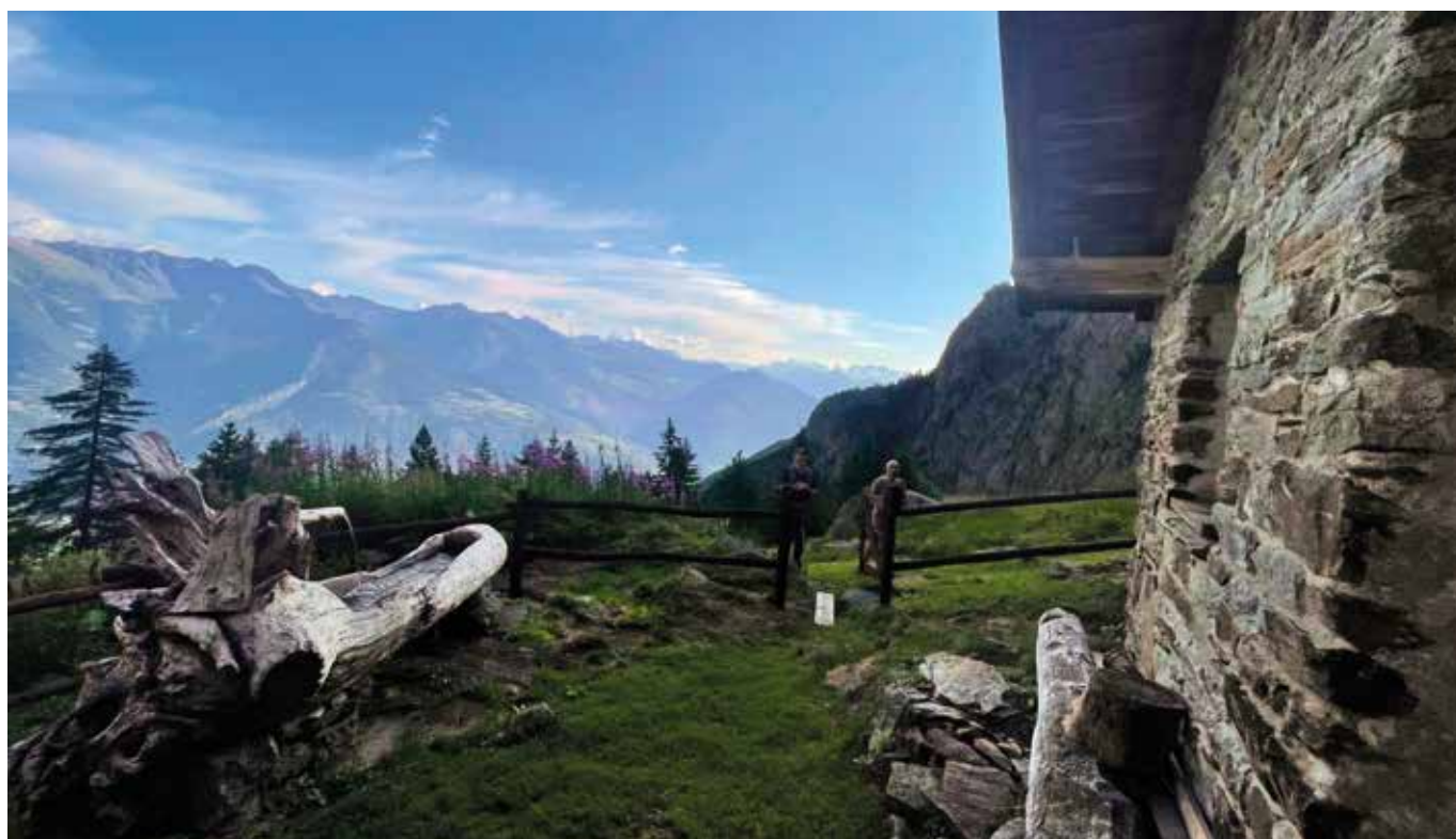
La vista dal Tramail.

Da qui, sulla destra, accanto ad una piccola baita diroccata, si nota la segnaletica gialla e si segue il ripido sentiero che sale nel bosco. Questa prima parte di percorso è sempre fresca e in ombra, grazie alle alte pareti che circondano il vallone, infatti, anche in piena estate, il sole arriva molto tardi al mattino. Il sentiero sale tra scorci sulla media valle, freschi boschi,