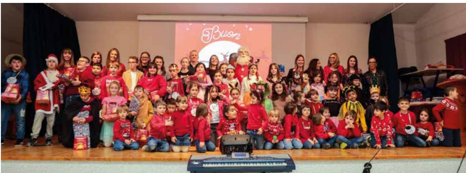
Spettacolo di Natale. La Scuola dell'Infanzia e la Scuola Primaria.

conoscere questa antica arte marziale. Andremo poi a visitare la caserma dei Vigili del Fuoco e parteciperemo ad uno spettacolo del C.E.A. di Gressan dove