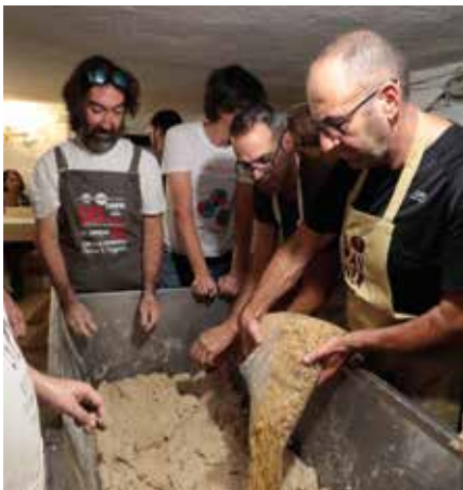
Aggiungiamo le noci!