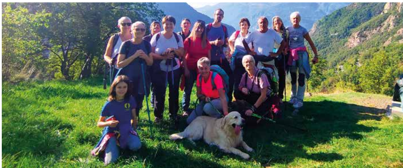
1° ottobre. Visita a Chemp.

In occasione di alcune feste si organizzano laboratori dove, con l'aiuto di esperti, si costruiscono semplici "lavoretti" che aiutano a sviluppare la manuali-