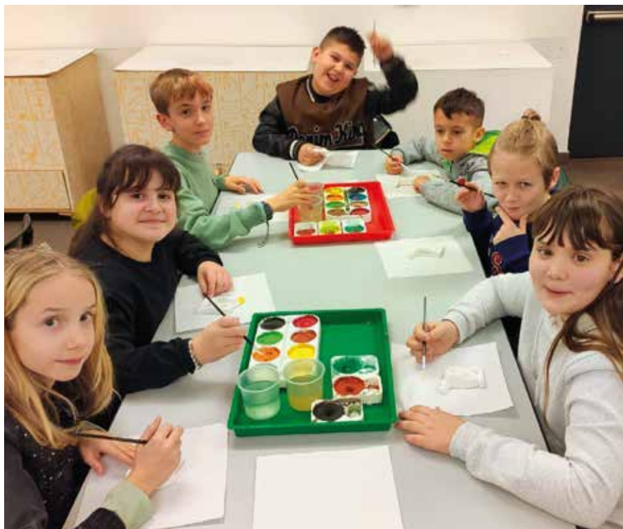
La pittura è una grande passione.