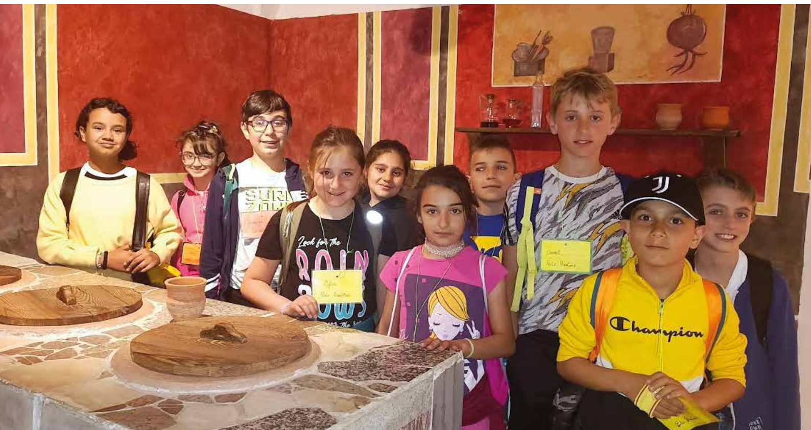
Guide turistiche per un giorno.