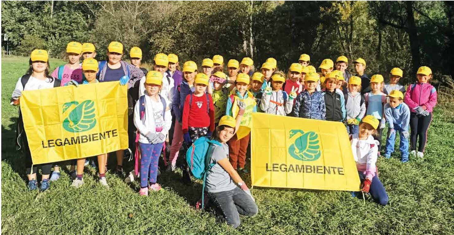
Puliamo il mondo.