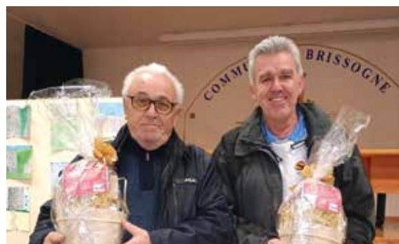
25 novembre. Festa di Santa Caterina. I vincitori del torneo di Belote.