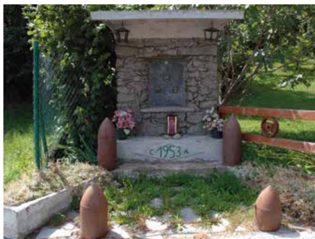
Le Moulin. Il monumento ai caduti.