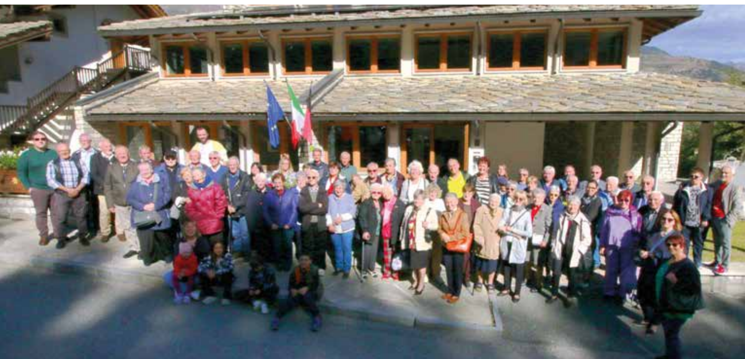
15 ottobre. Gruppo alla Festa degli Anziani.

Quasi 100 persone hanno partecipato alla Festa degli anziani organizzata dall'Amministrazione Comunale