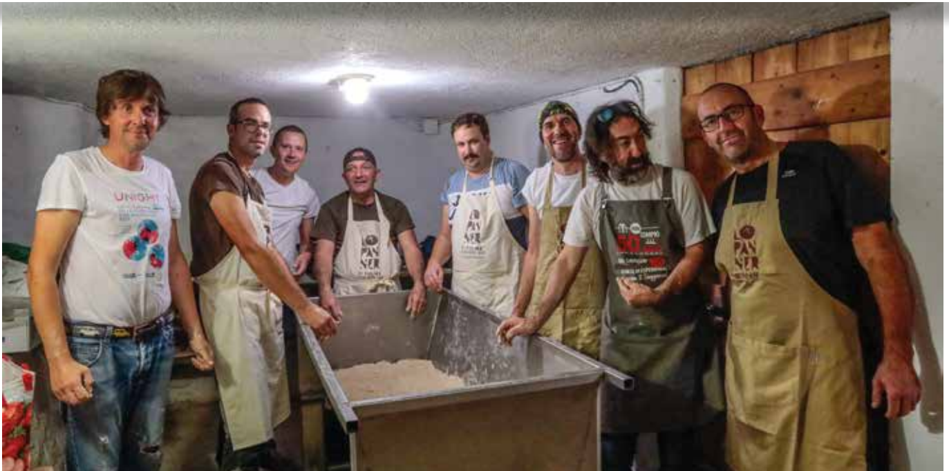
Si comincia molto presto ad impastare!