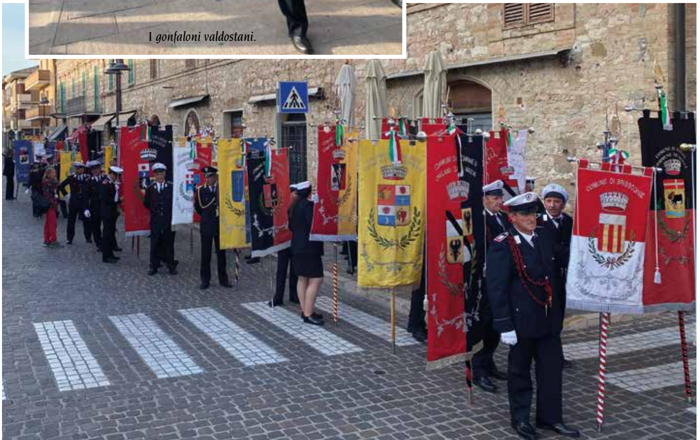
I gonfaloni valdostani pronti per la sfilata.

La giornata si chiude con il saluto del Ministro Generale dell'Ordine dei frati Minori e il pranzo insieme alla comunità religiosa.