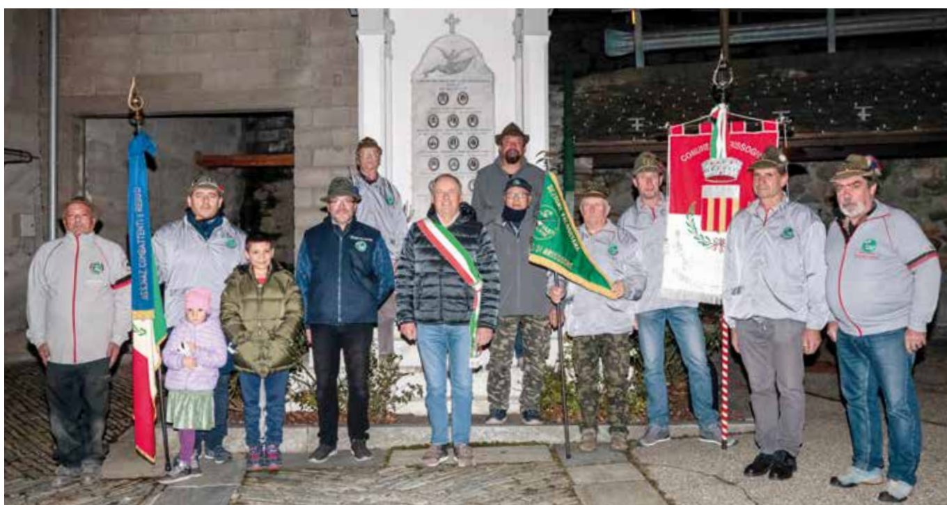
3 novembre. Gruppo alla commemorazione dei caduti.

gliorare si può sempre e siamo una grande squadra. Ora lo sguardo è rivolto al 2024 e già nuovi eventi ci aspettano, uno tra tutti l'Operazione Stella Alpina, ma non solo. Non resta che ringraziare tutti e un augurio di un Buon Anno.