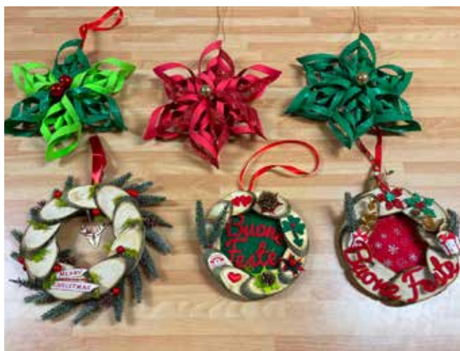
1° dicembre. Addobbi di Natale.

Anche quest'anno è stato organizzato, in primavera e in autunno, il corso di Ginnastica dolce: un momento in cui le persone possono prendersi cura di sé con una disciplina sportiva orientata al benessere, capace di adattarsi alle esigenze di sportivi e non. Movimenti lenti, attenta respirazione, benessere a 360 gradi, queste, in sintesi, le sue caratteristiche.