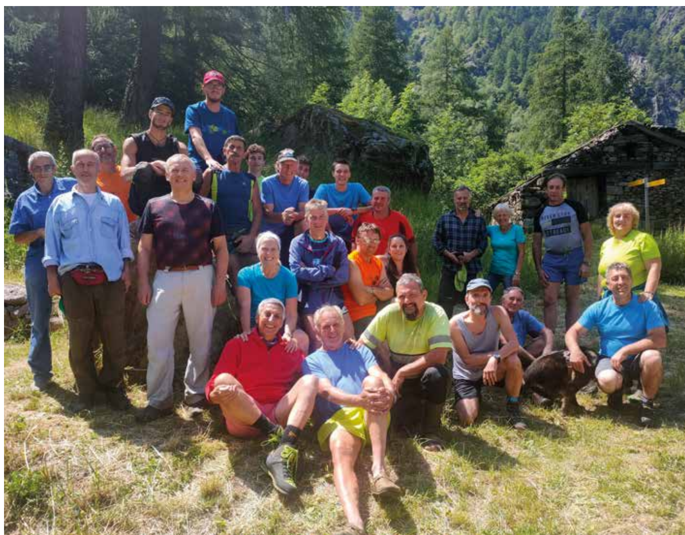
8 luglio. Gruppo di volontari alla corvée.

L'8 luglio 2023, infatti, i volontari dell'associazione si sono riuniti per svolgere l'annuale corvée, quest'anno diversi lavori hanno visto coinvolti gli associati, come ad esempio la pulizia del sentiero con i decespugliatori, la sistemazione di alcuni passaggi rocciosi, dare l'impregnante alle varie fontane lungo il sentiero e alle staccionate e il posizionamento di una ringhiera a protezione della baita del Tramail.