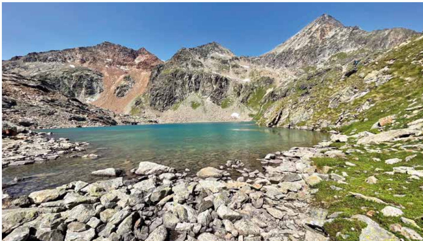
Lac d'en Haut, sullo sfondo il Mont Émilius.