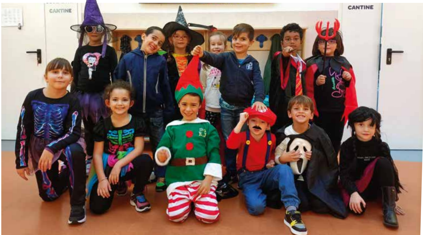
Mascherati per Halloween.