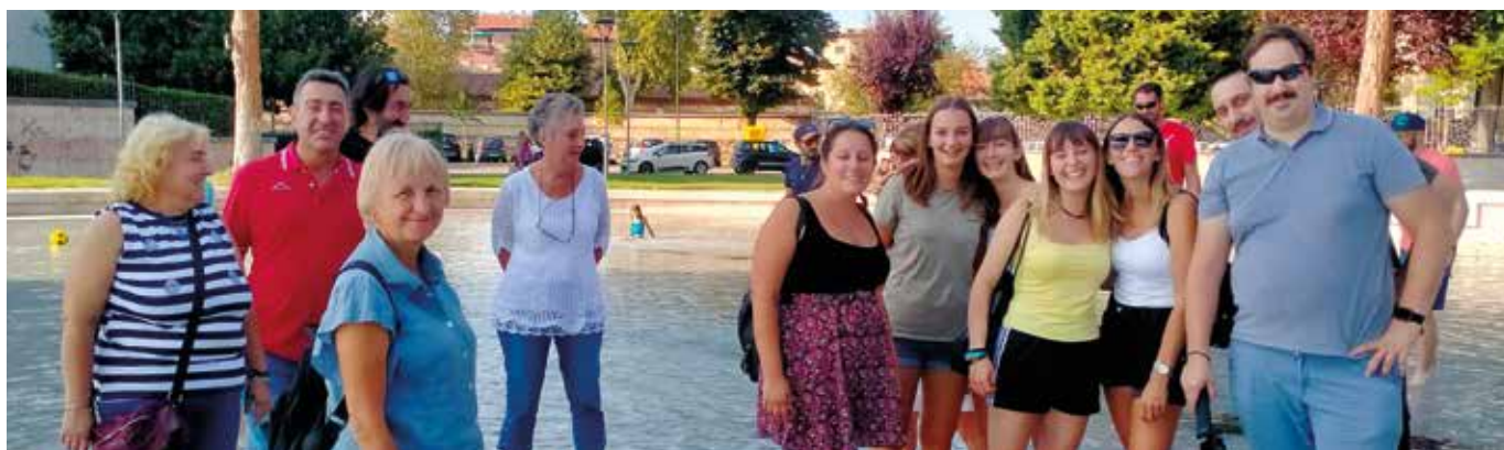
2-3 settembre. Gita a Verona.

zionale festa di Santa Caterina, patrona di Brissogne. Quest'anno si è riproposto anche il torneo di Belote a coppie fisse che ha visto un buon numero di partecipanti. Stessa cosa anche per la gara di torte sempre apprezzata da chi le prepara ma ancor più da chi alla fine della cena le può gustare.