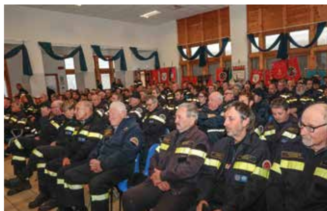
La platea gremita.

A conclusione dell'assemblea l'incontro è proseguito a tavola con l'ottimo pranzo preparato dai volontari della nostra Pro Loco.