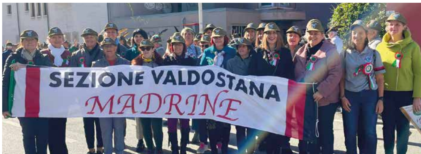
Le Madrine sfilano con il loro striscione.

Un appunto va fatto, ricordando che durante il 2023 molti volontari hanno dato il loro contributo anche durante il passaggio del Giro della Valle d'Aosta nella tappa che riguardava il nostro Comune, durante l'ultima eliminataria delle Batailles des Reines svol-