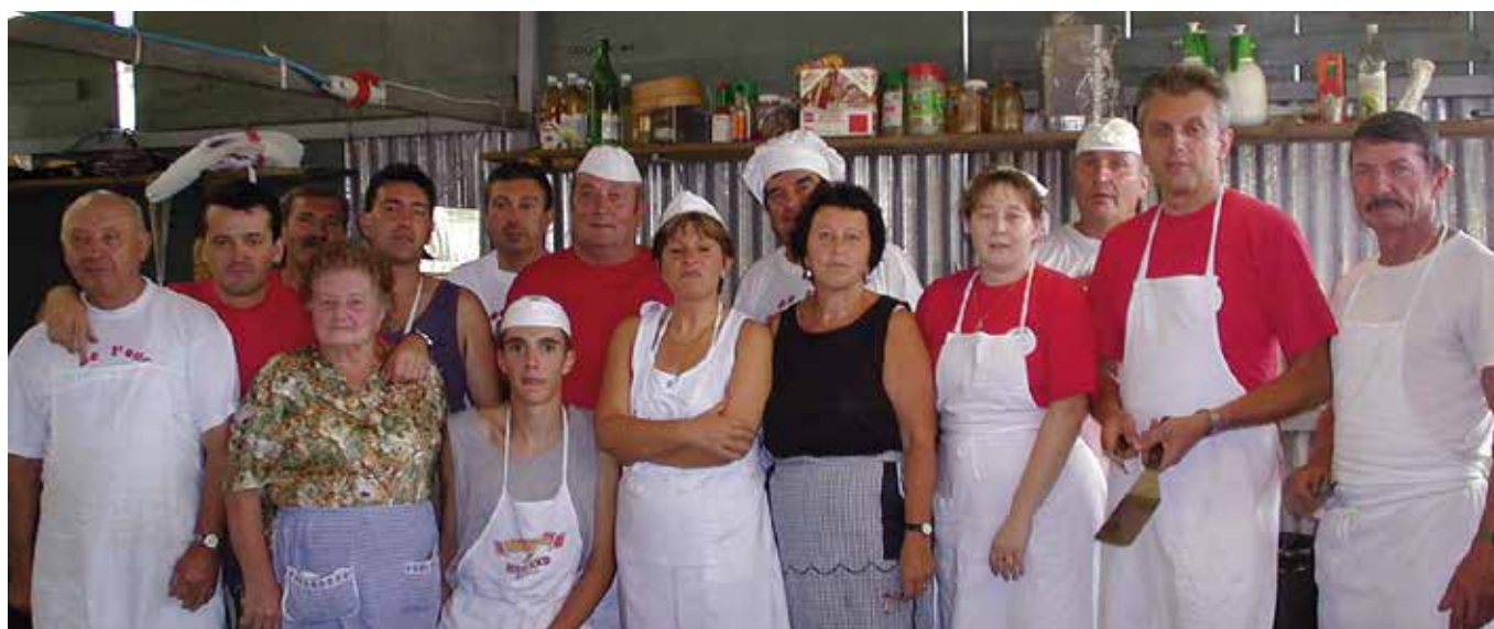
2000. Gruppo volontari di cucina Fëta de l'Oumbra.

immediata prossimità all'abitato, consente di poter gestire in maniera ottimale la Fëta de l'Oumbra. Tutti e tanti elementi che hanno perciò contribuito a rendere la Fëta de l'Oumbra una delle feste più longeve in Valle d'Aosta. Ma se location e strutture hanno il loro peso, il merito di tanta longevità e di tanto successo vanno conferiti in gran parte alla comunità di persone che da sempre è rimasta unita intorno al proprio paese e ai suoi cardini, come il vallone des Laures, l'allevamento, gli sport popolari ... e quella Pro