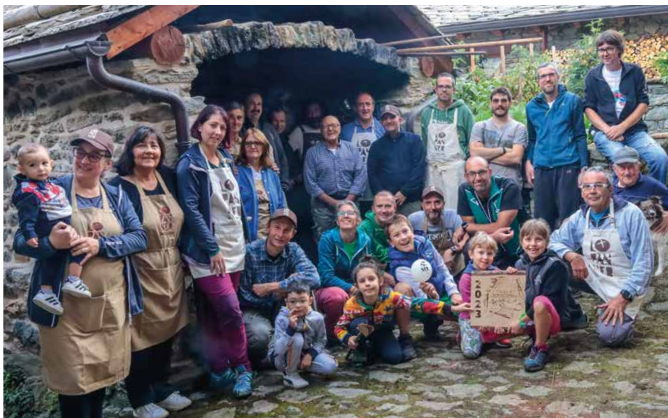
Gruppo di volontari.

A ottobre, e in particolare sabato 14, Lé-z-amì di Pan Nèer si sono ritrovati, come ogni anno da ormai 19 anni, per rendere il villaggio di Chesalet un'armonia di profumi e di suoni.