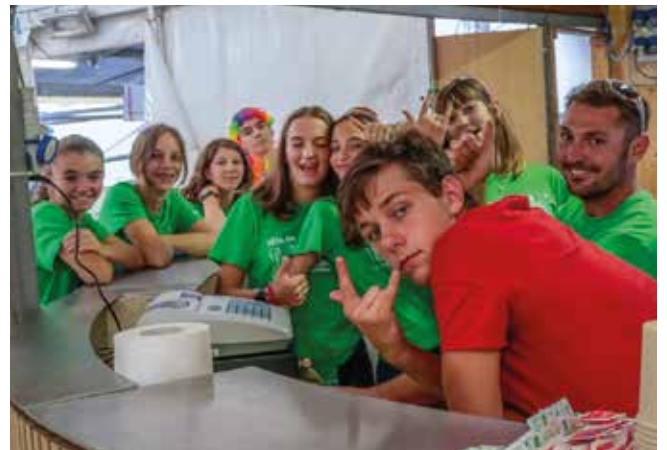
9-13 agosto. Fëta de l'Ombra. Si lavora con allegria.