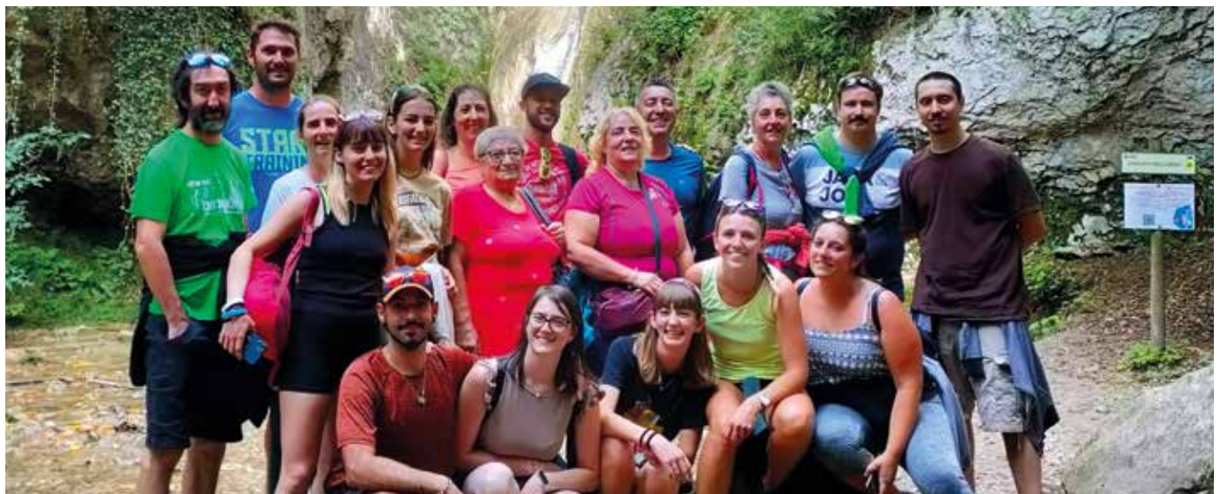
2-3 settembre. Gruppo in gita a Verona.