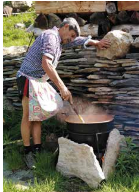
22 luglio. Festa de Les Laures. La polenta è quasi pronta.