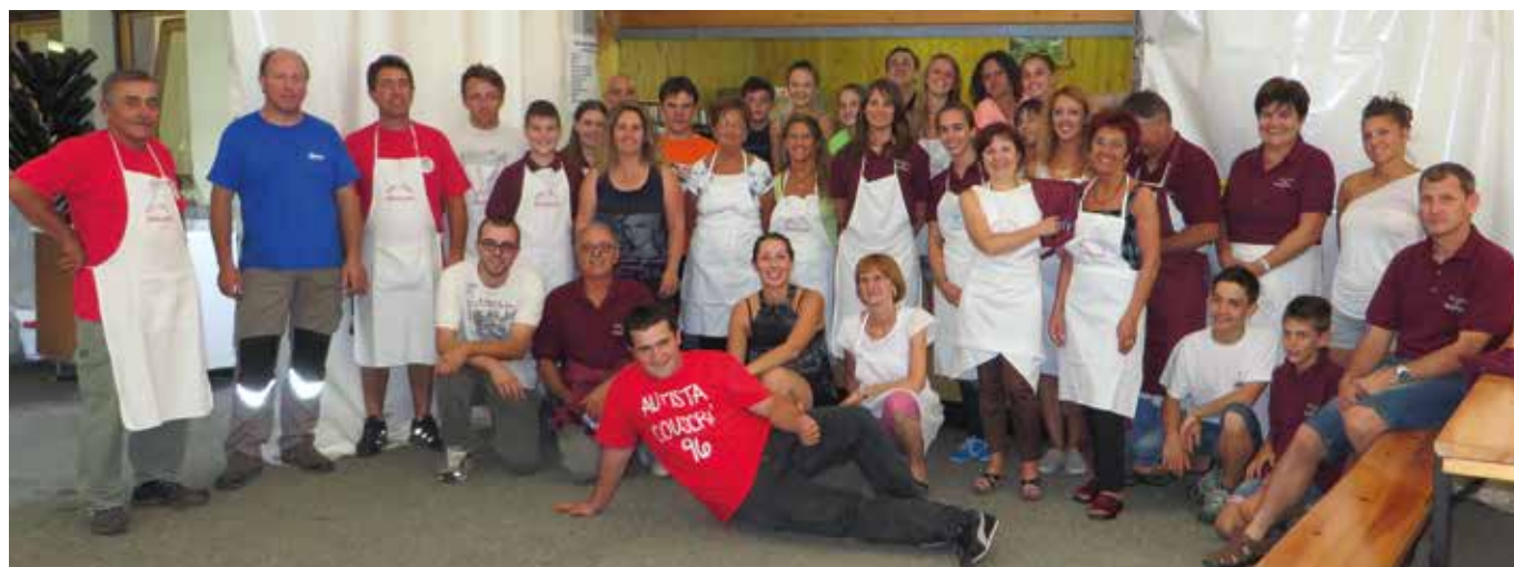
2014. Gruppo di volontari alla Fëta de l'Oumbra.