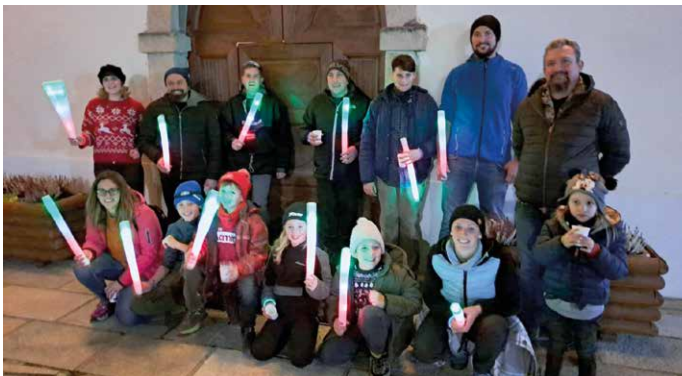
24 dicembre. I partecipanti alla fiaccolata di Natale.