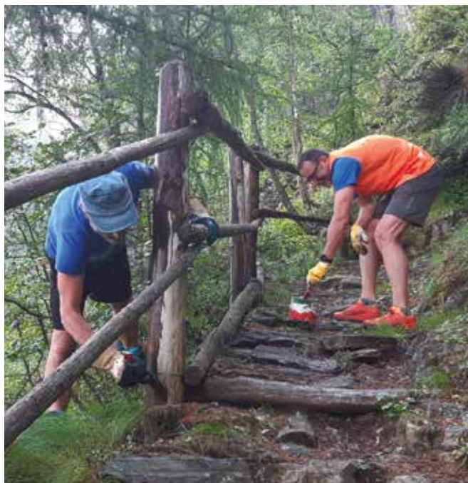
8 luglio. Corvée.

I tradizionali fuochi di San Pietro, organizzati il 29 giugno di ogni anno, sono stati accesi solo in prossimità della Cappellina a causa della meteo avversa. Si è approfittato, quindi, del pomeriggio uggioso per fare diversi lavori di casermaggio tra cui posizionare il nuovo boiler necessario per l'utilizzo dell'acqua calda.