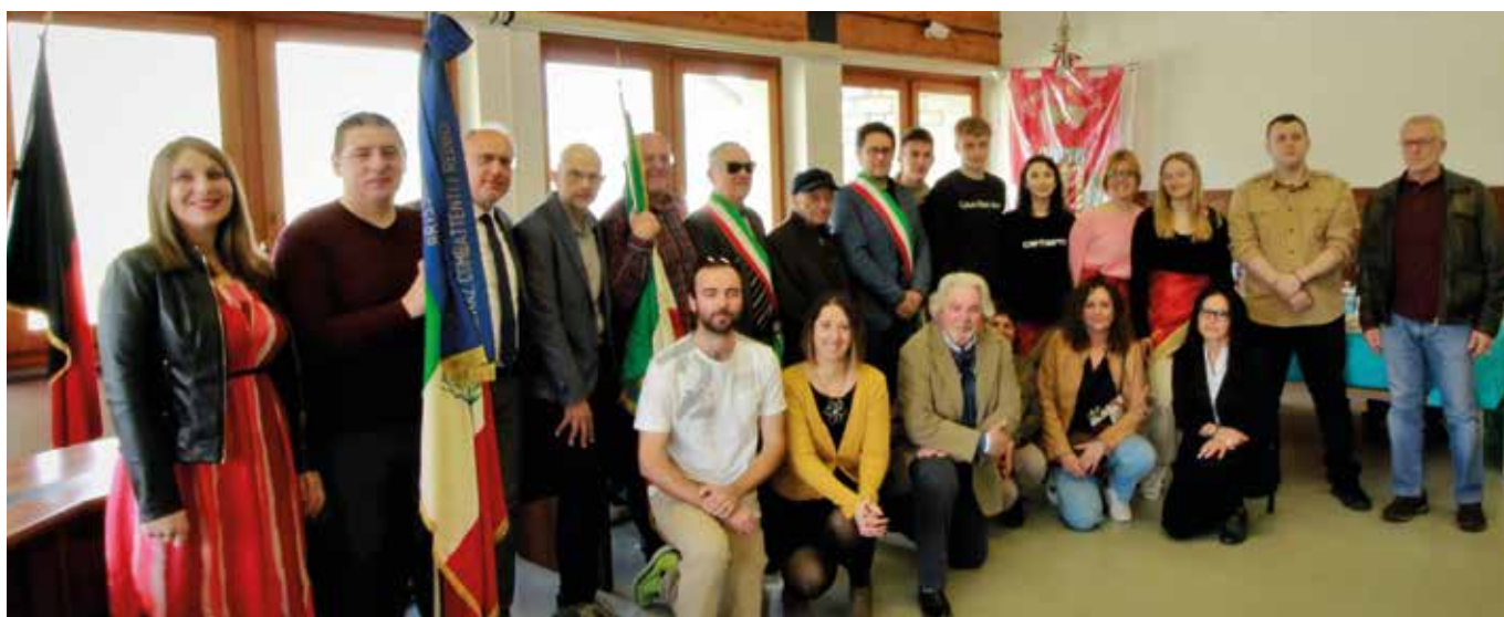
25 aprile. Gli Amministratori Comunali, i rappresentanti dell'A.N.P.I. e i diciottenni.