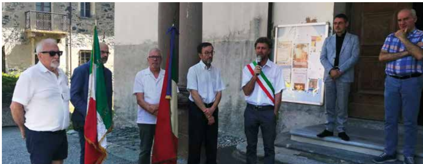
25 giugno. Commemorazione a Fénis.

opera di Émile Lexert; banda che oltre all'uccisione prematura del proprio capo ha subito il tragico rastrellamento nel 21 febbraio '45 della Morgnetta ed altre azioni di imboscate e rappresaglia a detrimento dei propri componenti e della popolazione tutta.