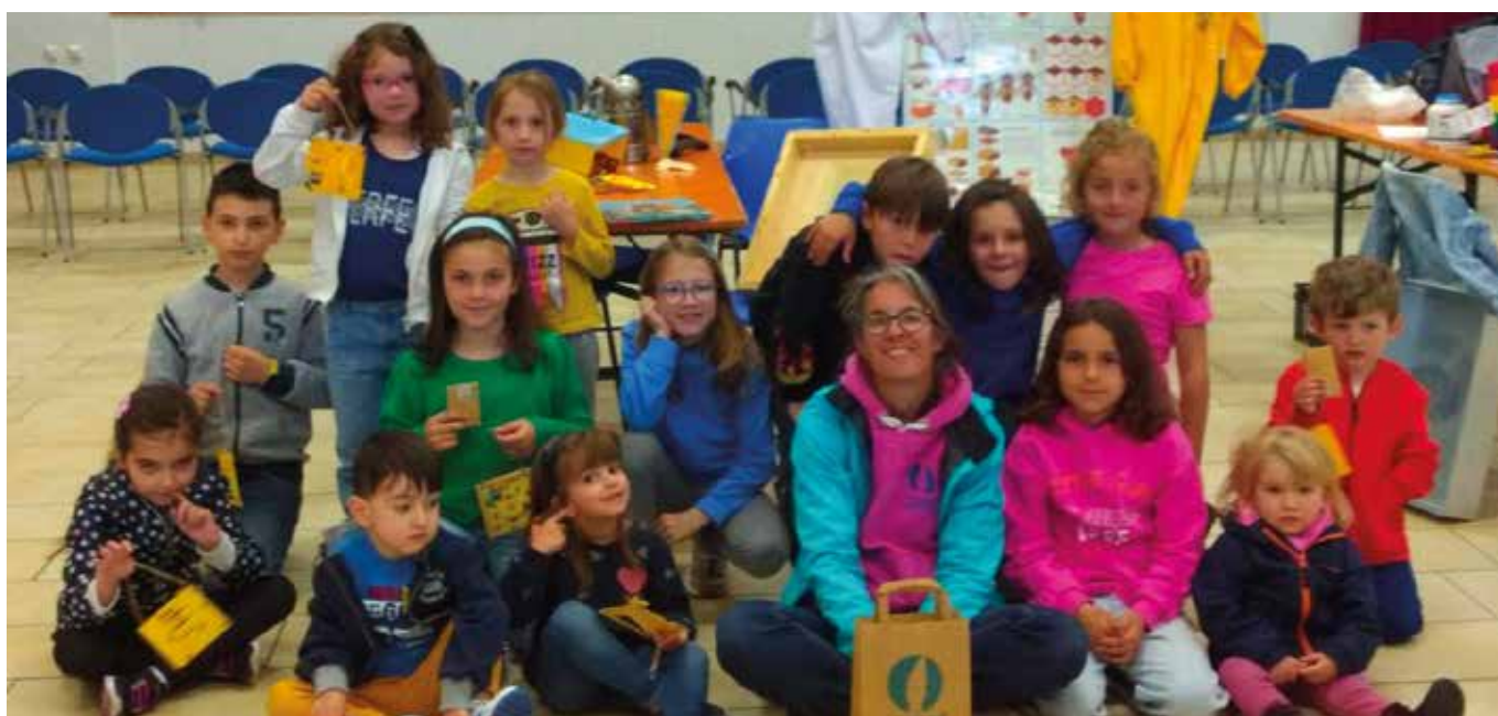
20 maggio. Conoscendo il mondo delle api.

tà, favoriscono la collaborazione e la socializzazione fra i partecipanti.