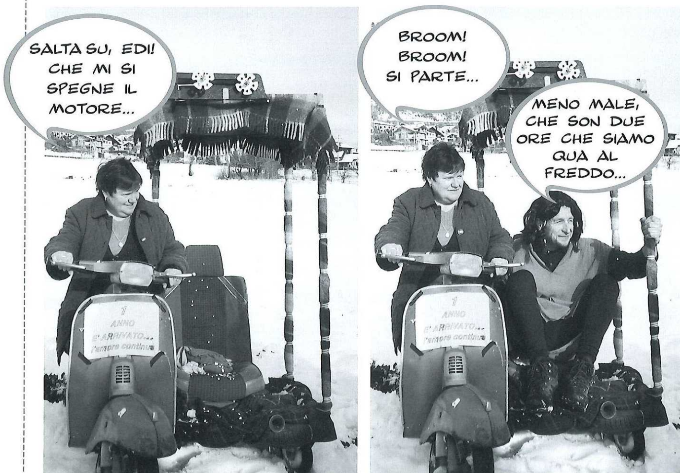
Carnevale 2004 - Inaugurazione della nuova linea di trasporto pubblico «Irmetta Tour Operator»