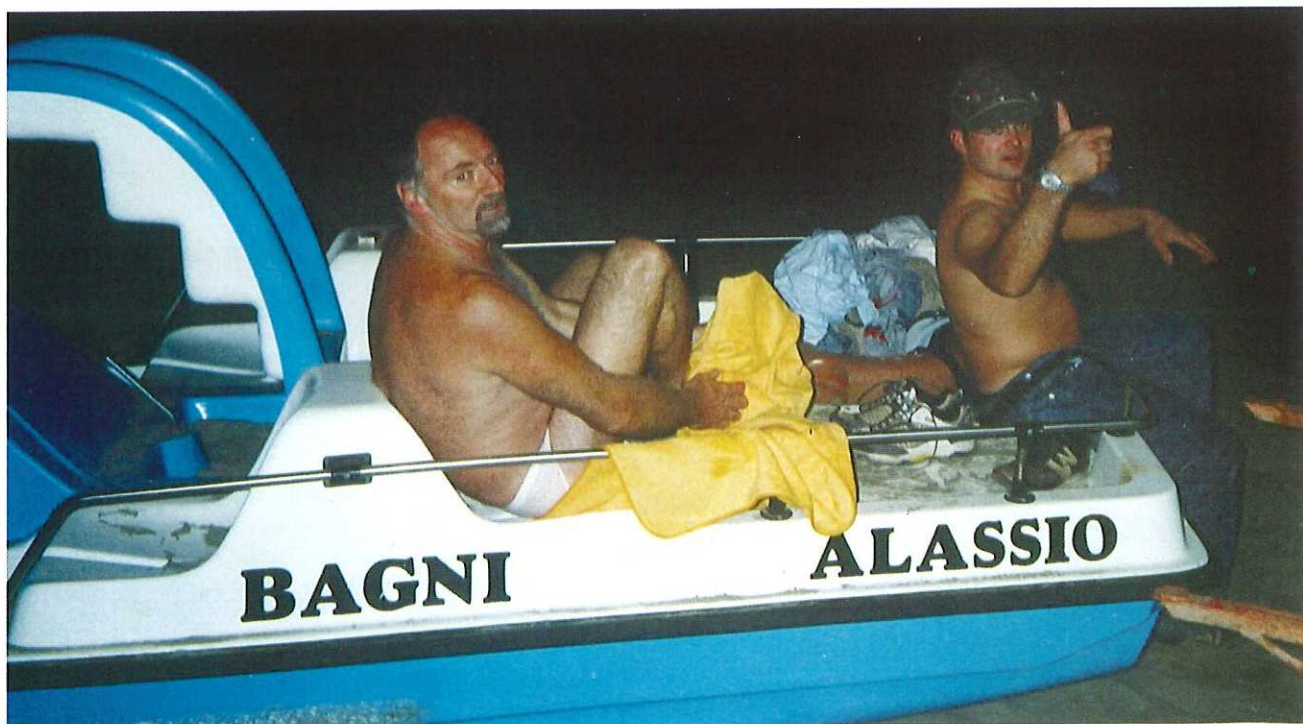
Alassio (SV), 4 novembre 2006: un bagno alpino... fuori stagione!