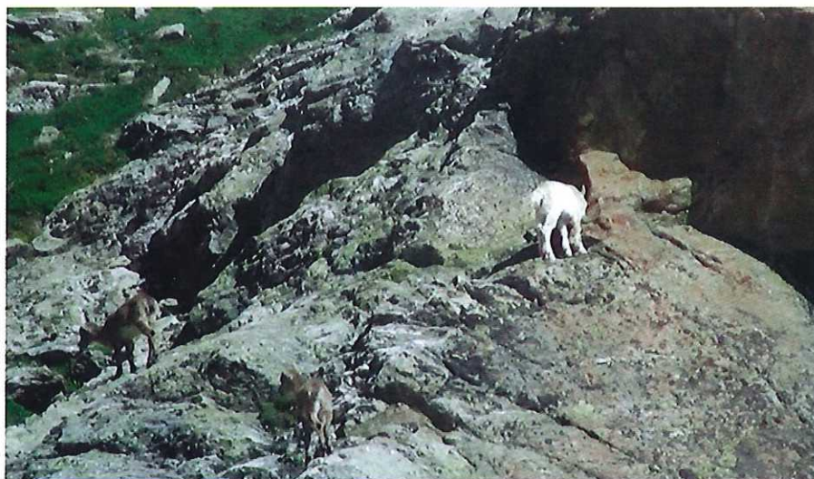
La foto scattata dai coniugi Borre il 23 luglio 2006 e pubblicata sul n. 40 de Les Laures (marzo 2007)

A nno 1978: arriva in Italia il cartone animato Heidi, trasmesso da RAI 1. E per quelli della mia generazione, le storie della bambina svizzera e di suo nonno, del cane Nebbia, di Peter, di Clara e della terribile signorina Rottermeyer sono un autentico cult. Un ricordo d'infanzia carico d'affetto, da custodire gelosamente in fondo al cuore. E, poi, diciamo, per noi valdostani quel cartone animato era un po' come rivivere la nostra regione: gli alpeggi, la mungitura, il latte ed il formaggio, le praterie alpine, le mandrie al pascolo, le aquile, la neve. Ed ancora: la nonna con il foulard intenta all'arcolajo, i nidi degli uccellini, il fuoco a legna, il cane pastore, i sabot del nonno, le tradizioni. Mucche poche, d'accordo,